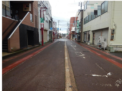
【Aの進行方向から見た現場の状況】