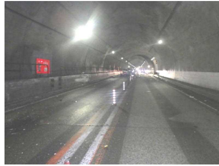
【本件事故現場の状況】