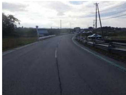
【Aから見た本件事故現場の状況】