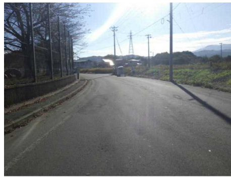
【本件事故現場の状況】

正面衝突事故による交通死亡事故の発生は今年4件目！ 同事故形態での死者は5人で、全死者の約4分の1を占める！