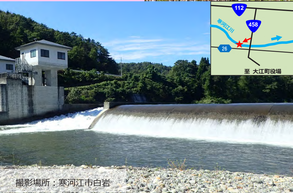
撮影場所：寒河江市白岩

夏の暑い日、涼を求めて訪れるのにおすすめのスポットが高松堰頭首工だ。この施設は寒河江市と大江町の農地を潤している。付近にはベンチもあるため、頭首工を爽快に流れる水の音を聞きながら涼むことができる。