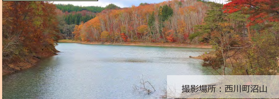
撮影場所：西川町沼山