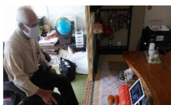
デジタル技術を活用した高齢者の社会参加の維持・拡大

交通、防災、医療、福祉、教育等、暮らしを支える様々な分野における、広く県民が利便性を享受できるデジタル技術活用の推進