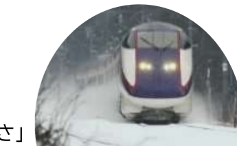
山形新幹線「つばさ」

観光、ワーケーションなどによる交流人口の拡大や、交流拡大による地域産業の活性化等、鉄道ネットワークを通して県内全域に波及する沿線活性化の取組みの推進