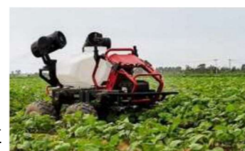
運搬や液剤散布を自動で行う農業用無人車

「みんなが使えるスマート農林水産業」の実現に向けた技術の開発・実証や、普及に向けた支援・人材育成の推進