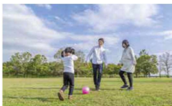
「子育てするなら山形県」(イメージ)

結婚・妊娠・子育てのそれぞれのステージにおいて希望が叶い、「山形しあわせLIFE」が満喫できるよう、応援プログラムを一体的に推進