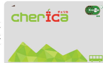
令和4年5月に導入された地域連携I Cカード「チェリカ」

「チェリカ」から得られる移動に関するデータ等の分析を通じた効果的な路線・ダイヤの見直し等、地域公共交通の利便性向上