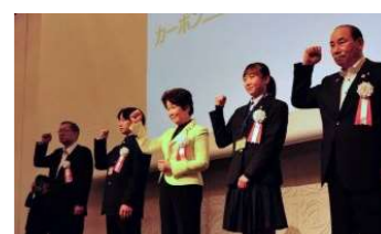
カーボンニュートルやまがた県民運動推進大会(キックオフイベント)

「カーボンニュートラルやまがたアクションプラン」に基づく徹底した省エネの推進や、再生可能エネルギーの導入拡大等の県民運動の展開