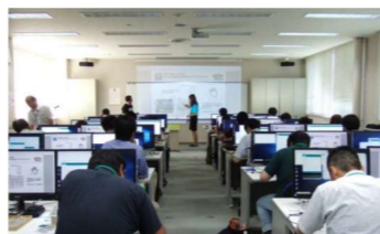
I o T、A I等を現場で活用できる人材育成のためのセミナー

デジタル技術等、新しい時代に求められる知識・技術を活用できる人材の学び直し（リスキリング等）による育成