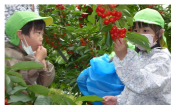
未就学児のさくらんぼ狩り体験

幼少期から「山形らしさ」に触れ、ふるさとへの理解や愛着を育む活動や、地域の魅力を主体的に学ぶ取組みの強化