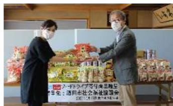
食品の寄付を受け支援が必要な方々へ届けるフードバンク活動

高齢者や貧困家庭等の孤独・孤立など、コロナ禍の中で顕在化した課題に対応するための、「つながり」や「支え合い」を促進する取組みの強化