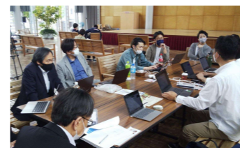
自律的な地域課題の解決を目指す Yamagata yori-i project

新しい産業の創出に向けた地域課題解決のためのビジネスモデルの構築、スタートアップへの支援等の取組みの推進