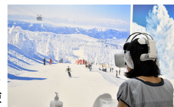
V R映像による蔵王の樹氷体験

旅行者の行動履歴等のデータ分析に基づく観光地経営の向上や、新たな体験コンテンツの開発など、インバウンド回復・拡大も見据えた誘客戦略の展開