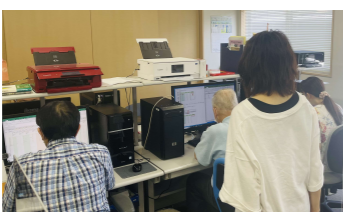
デジタル関連業務に取り組む施設利用者と職員(イメージ)

障がい者就労支援施設で働く障がい者の工賃向上に向けた、工賃単価の高いデジタル関連業務を全国から受注する取組みの推進