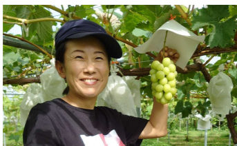
首都圏からのUターンによる新規就農

リアルな移住体験に加え、デジタル技術を活用した体験など、多様な手法を組み合わせた移住・定住促進策の展開