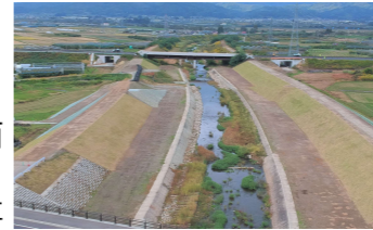
令和2年7月豪雨被災箇所への堤防復旧・高上げ工事

平時から防災を意識する取組みの促進、「流域治水」や土砂災害対策の推進、緊急輸送道路及び孤立危険集落アクセス道路の確保に向けた道路整備の加速