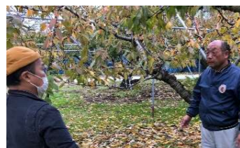
首都圏のシェフを誘致しての農産物の付加価値向上に係る意見交換

優れたものづくり技術や特色ある農林水産業等、本県の有する地域資源を活用した県外の多様な人材との交流の促進