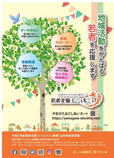
若者支援コンシェルジュチラシ

地域活動に意欲的に挑戦する若者のフォローアップ及び若者たちが気軽に相談できる窓口の設置や若者サポーターの配置により、ニーズに沿った活動へのサポートを展開するとともに、若者たちの新たな繋がりや広がりによる、県内の若者活動の活性化を図る。