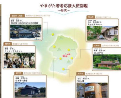
「山形には何もない」と思ったら開く図鑑