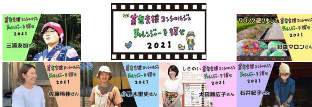
動画「チャレンジャーを探せ」

公開先：「やまがたおこしあいネット」内の特設ページ「チャレンジャーを探せ2021」及び若者支援コンシェルジュの YouTube チャンネル