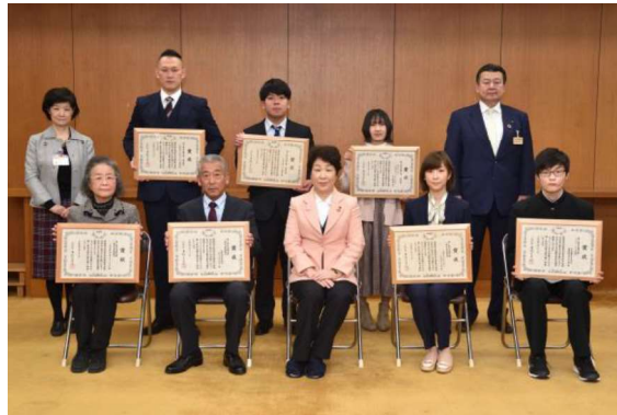
2021 輝く県民活躍大賞 受賞者