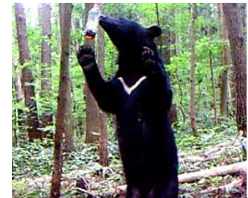
カメラトラップ調査状況