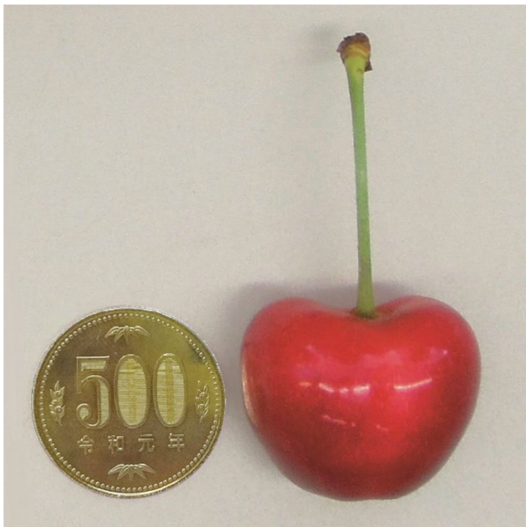
さくらんぼ大玉新品種 やまがた紅王