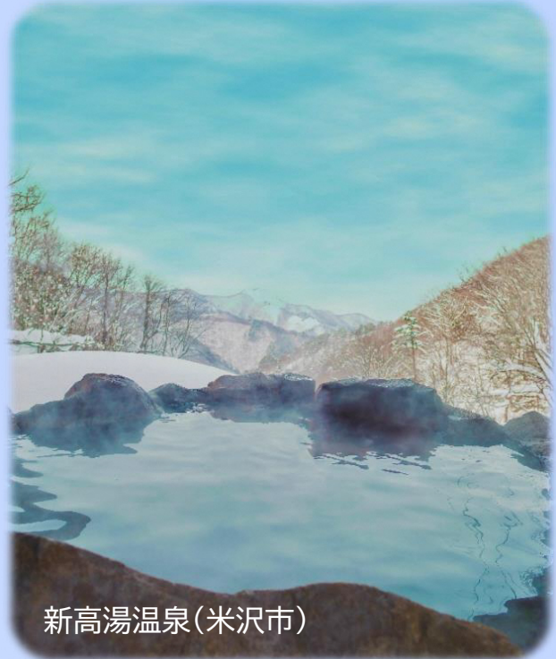
新高湯温泉(米沢市)