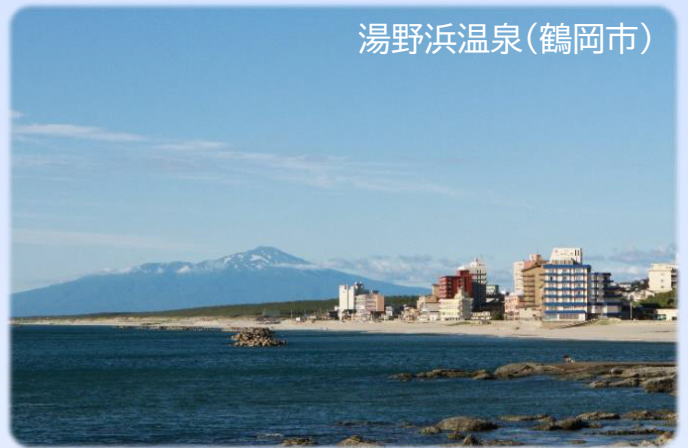
湯野浜温泉(鶴岡市)