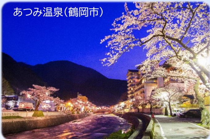
あつみ温泉(鶴岡市)