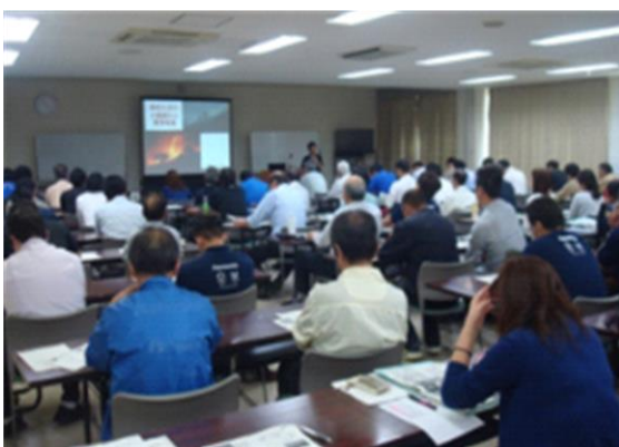
環境マイスターフォローアップ研修