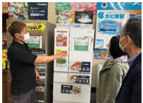
店頭にて統一省エネラベル表示 消費者へ分かりやすくアドバイス