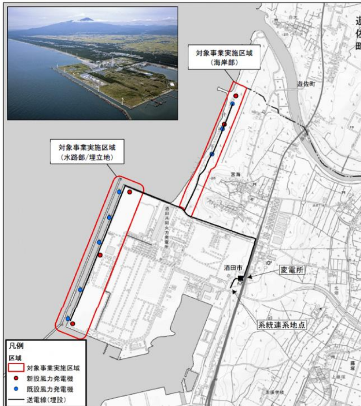
対象事業実施区域等