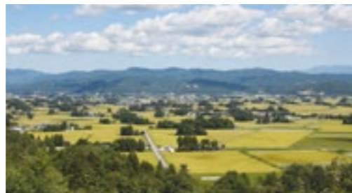
飯豊町田園散居集落