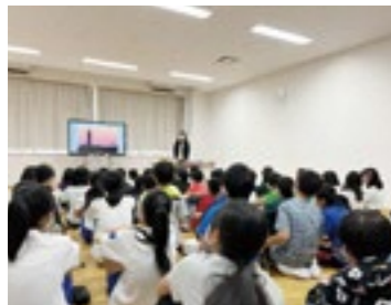
小学校での出前授業の様子