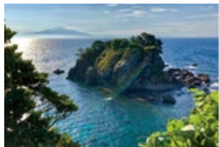
飛島から見る日本海と鳥海山

山形ならではの美しい景観を体感できる「ビューポイント」は、現在60箇所あります。公式ホームページでは、ビューポイントの見どころやアクセス情報、付近の観光スポット等を紹介しています。この機会に県内各地を巡ってみませんか。