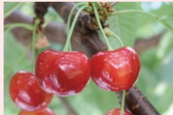
たわわに実る「やまがた紅王」

今年はプレデビューのため販売数量が限られますが、本格販売以降、生産量は年々増加します。