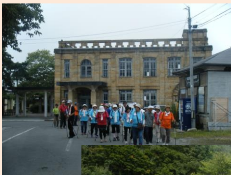
(うきたむ風土の丘にて)

毎月、季節に合わせた町内外の特色あるコースでノルディックウォーキングを実施しています。ノルディックウォーキングのインストラクターの資格を持つ会員からの指導を基に、効果的な運動に繋がっています。