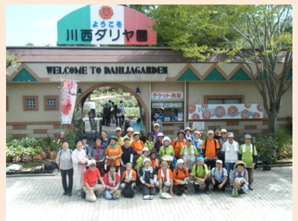
(川西町民とのノルディックウォーキング交流会)

他市町のノルディックウォーキングの教室や行事への参加及び河北町内の救護施設に訪問し、ノルディックウォーキングの普及や参加者との交流を図っています。