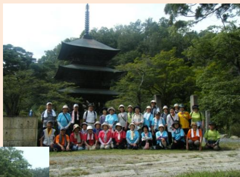
(安久津八幡三重の塔にて)