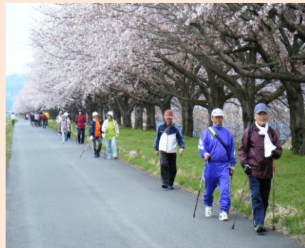
寒河江川をウォーキング!