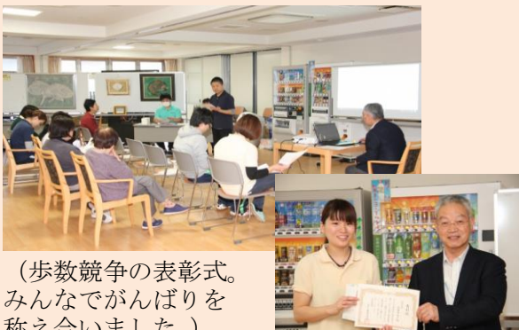
（歩数競争の表彰式。みんなでがんばりを称え合いました。）

健康づくりに関する事業を企画し実施しています。（平成28年は、ユニット対抗で歩数競争を行いました。）