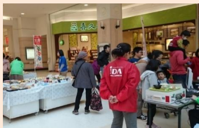
食育サツシステムを活用した栄養バランス診断会（イオンモール山形南）

栄養士や米沢栄養大学と連携した栄養バランス診断会。フードモデルの組み合わせで、食事内容の確認が簡単にできます。