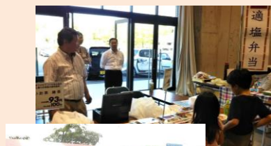
やまがた健康フェア

健康フェアやおしゃれなマルシェで、米沢栄養大学の学生とともに適塩弁当の販売やPRを実施しました。