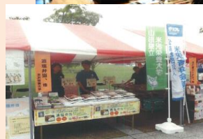
おしゃれなマルシェ