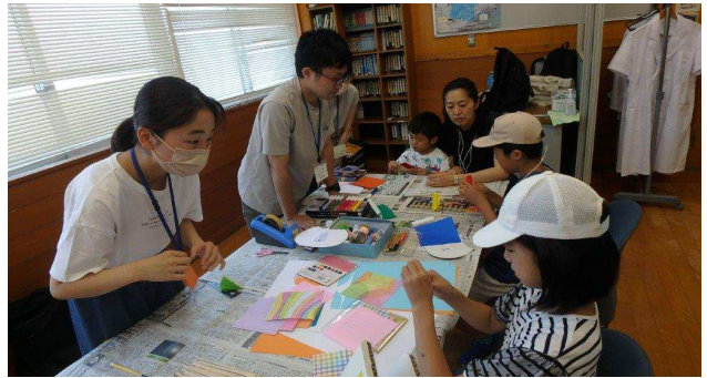
うちわをつくろう！