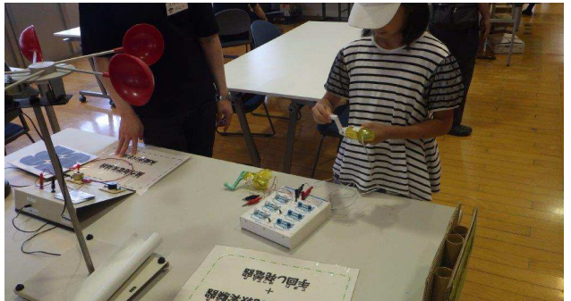
発電実験器で遊ぼう！