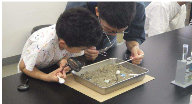
マイクロプラスチックをさがせ！