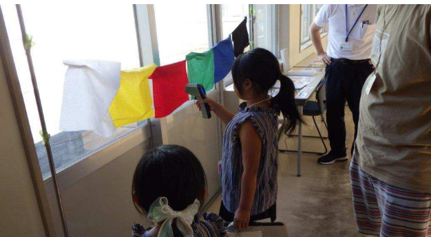
色による温度の違いを調べよう！