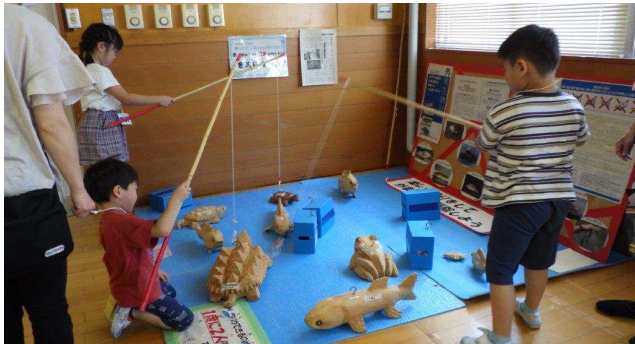
魚釣りゲームで外来生物について学ぼう！