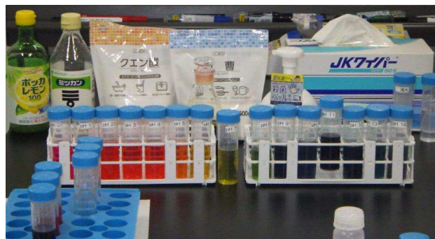
酸性・アルカリ性を調べよう！