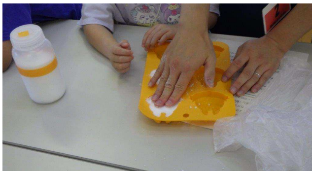
バスボムをつくろう！