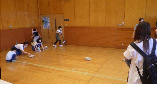
エアカーリングで遊ぼう！