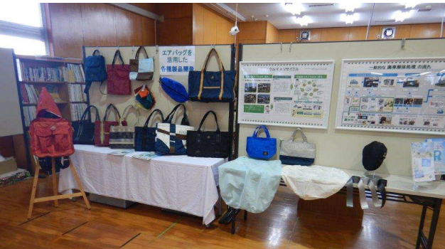
展示（自動車販売店リサイクルセンター）