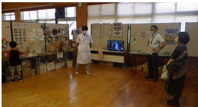
展示 (リサイクル工作、名水など)