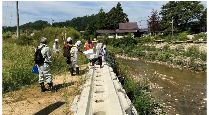
小白川災害復旧助成事業立会状況(9月14日)