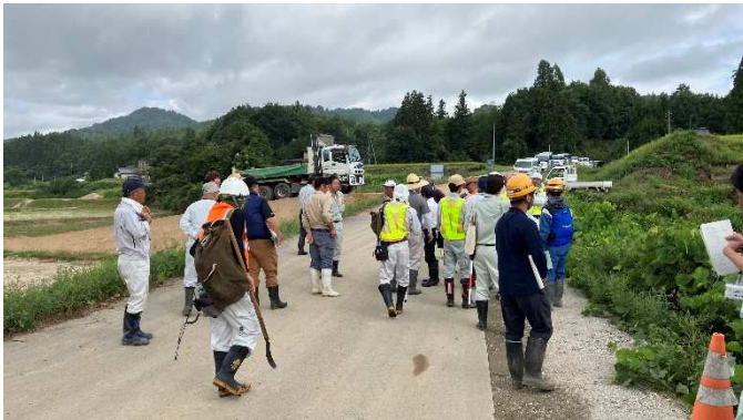
小白川災害復旧助成事業立会状況(9月5日)