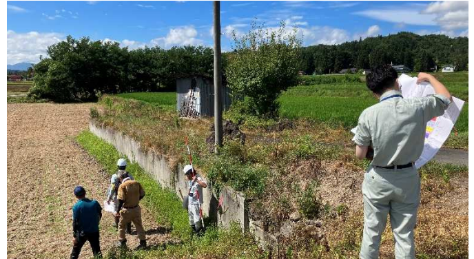
萩生川災害関連事業立会状況(8月9日)

○小白川災害復旧助成事業(置賜白川～芋兀橋) 上流側 9月5日(火)、下流側 9月14日(木)