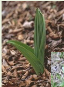
芽 出 し 期 の バ イ ケ イ ソ ウ