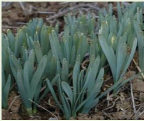
ス イ セ ン