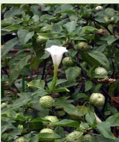
チ ョ ウ セ ン ア サ ガ オ の 葉 と 花