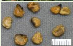
チ ョ ウ セ ン ア サ ガ オ の 種