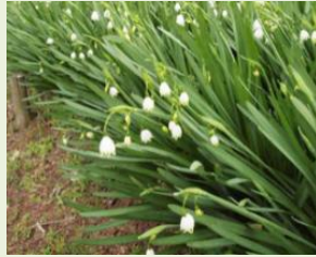
ス ノ ー フ レ ー ク （ ス ニ ン ス イ セ ン）