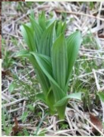
芽 出 し 期 の コ バ イ ケ イ ソ ウ