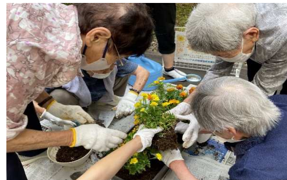
認知症の人にも参加して市役所などにオレンジ色の花を植える活動

《主なKPI》 認知症サポーターの養成数（累計） 【現状（R5）】17.5万人 ⇒ 【目標（R11）】22万人