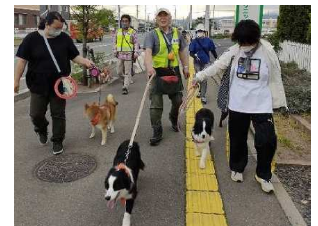
愛犬の散歩を通じた認知症サポーターによる見守り活動 認知症のシンボルカラーオレンジ色のバンダナが目印

《主なKPI》 チームオレンジの整備 【現状（R5）】8市町村 ⇒ 【目標（R11）】全市町村