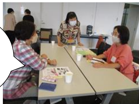
参加者はミニ講話後のフリートークで、エネルギー充電！