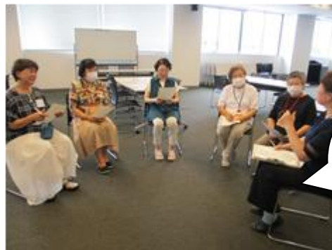
認知症カフェ開始前のチームオレンジのミーティング