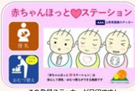
この登録ステッカーが目印です!

今年度から、県内の商業施設などの協力をいただき、「赤ちゃんほっと♥ステーション」の登録制度をはじめました。これは、赤ちゃんや小さなお子さんを連れたママ・パパが、外出先でも安心して授乳やおむつ替えができるよう、要件を満たす施設を登録・周知する取り組みです。登録施設は「やまがた子育て応援サイト」に掲載していますので、ぜひ活用ください。