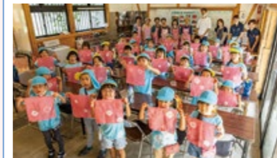
※撮影時のみマスクをはずしています

保育園や幼稚園を対象に、果物狩りや紅花染めなど、幼少期から地域の魅力・素晴らしさに触れ、体験してもらうモデル事業を実施中です。