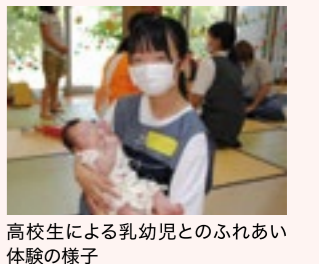
高校生による乳幼児とのふれあい体験の様子

女性も男性も子育てしながら無理なく働くことができる企業の職場環境づくりや、子育ての負担が女性に偏ることがないように、男性の育児・家事への参画を促進するなど、「子育てするなら山形県」の実現に向けて、取り組みを進めていきます。