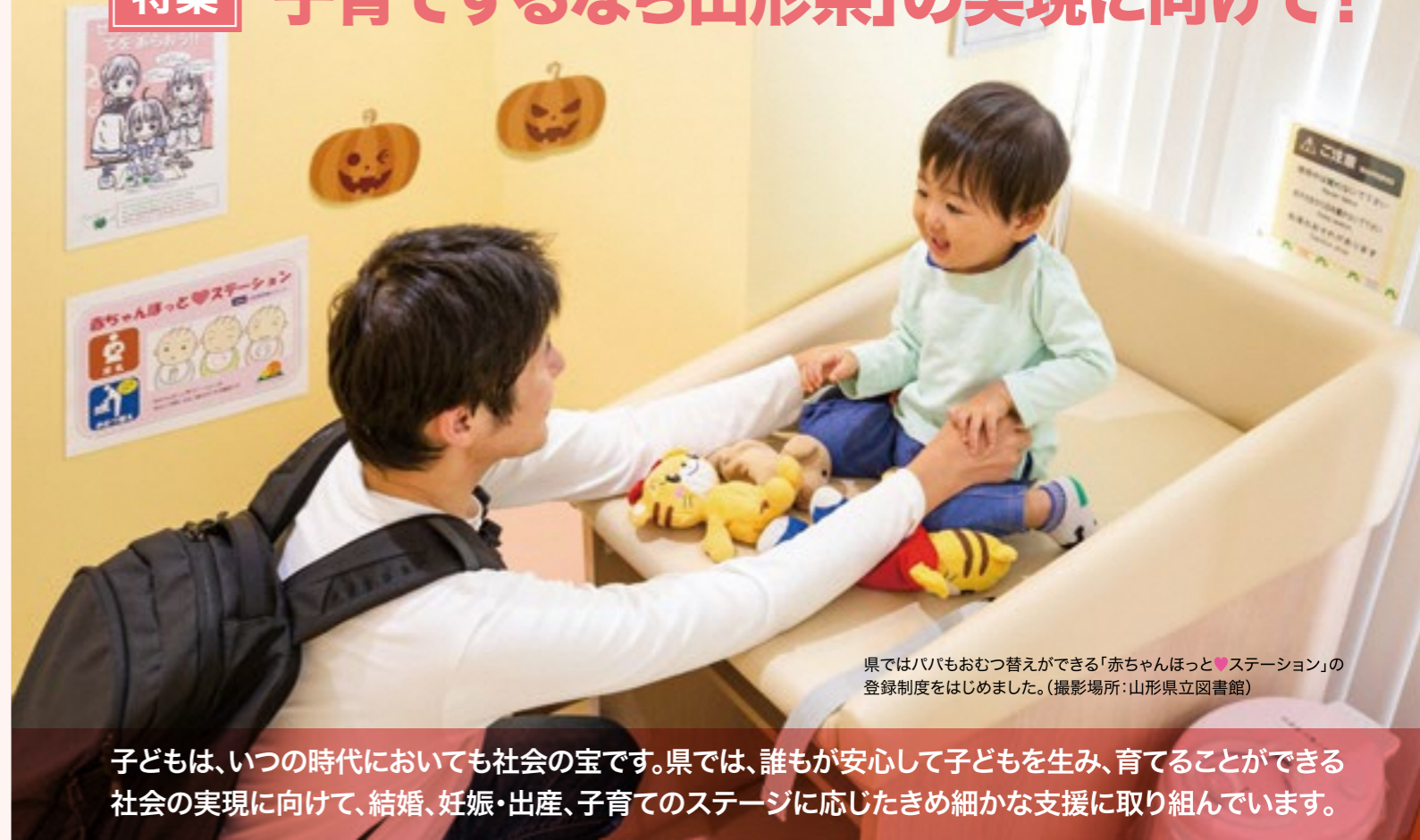
県ではパパもおむつ替えができる「赤ちゃんほっと♥ステーション」の登録制度をはじめました。(撮影場所:山形県立図書館)

子どもは、いつの時代においても社会の宝です。県では、誰もが安心して子どもを生み、育てることができる社会の実現に向けて、結婚、妊娠・出産、子育てのステージに応じたきめ細かな支援に取り組んでいます。