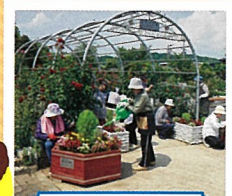
フラワープランター