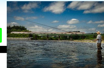
鉄道特別賞「つばさを見ながら」賞品（陸羽東線全27駅駅名プレート）