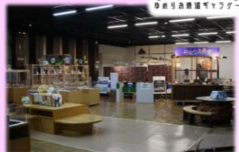
ゆめりあ鉄道ギャラリー