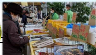
線路がつなぐ 石巻・庄内海鮮市