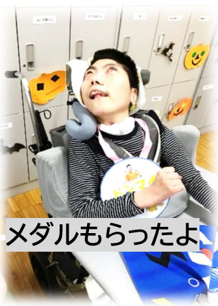
メダルもらったよ