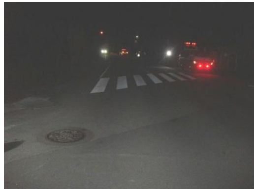
【Aの進行方向から見た現場の状況】