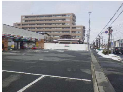
【本件事故現場の状況】