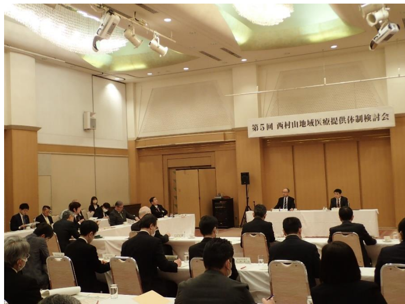
県と1市4町による会議