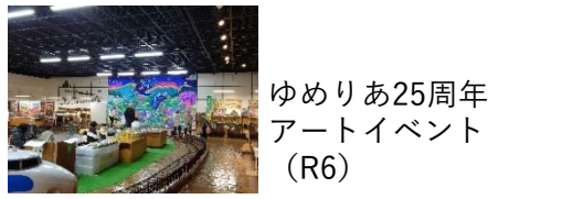
ゆめりあ25周年アートイベント (R6)