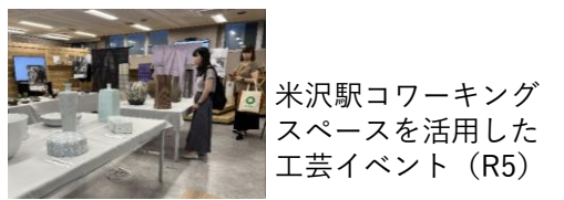
米沢駅コワーキングスペースを活用した工芸イベント (R5)