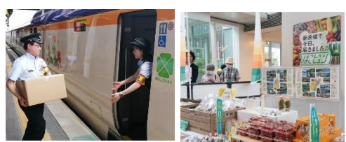
新幹線を活用した置賜地域の果物等の輸送 (R5)