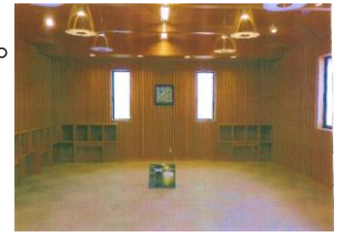
真室川駅併設森の停車場2階多目的スペース改修 (R6)