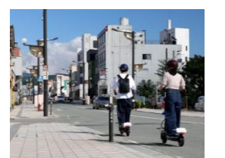
ゆめりあ電動キックボードレンタル (R5)