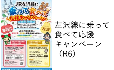
左沢線に乗って食べて応援キャンペーン (R6)