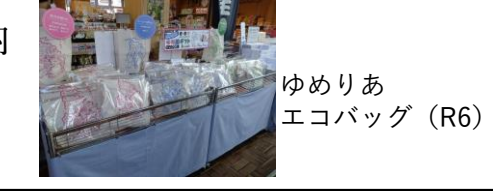
ゆめりあエコバッグ (R6)