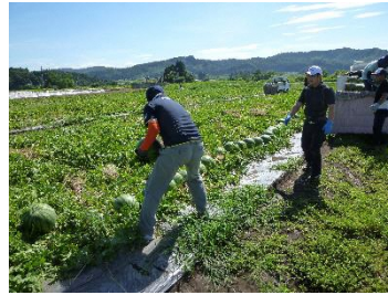
すいか収穫作業イメージ