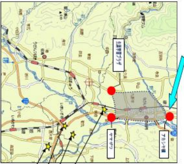
■ 奥井エリア ※1

奥井エリアは [shaded gray] で囲まれたエリア内であればどこでも乗り降りすることができる。 また、★の特別ポイントでも乗り降りすることができます。