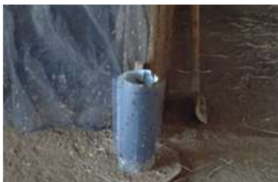
媒介昆虫粘着シート