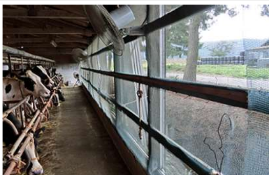
畜舎周辺への防虫ネット設置