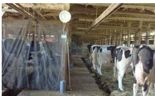
抗体陽性牛と陰性牛の分離飼育