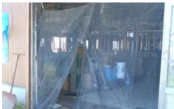
畜舎開口部への防虫ネット設置