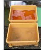
推奨される踏込消毒槽の設置方法！