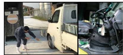
車両はタイヤだけでなく、 泥よけの内側 まで消毒し、 フロアマットの交換 や ペダル等車内 も消毒