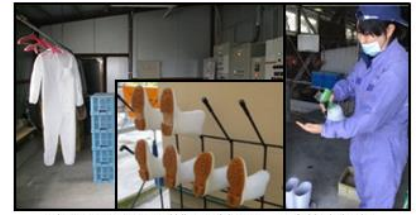
専用の服や靴の使用、手指消毒