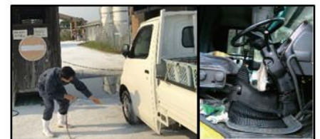
車両はタイヤだけでなく、 泥よけの内側まで消毒 し、 フロアマットの交換やペダル等車内も消毒