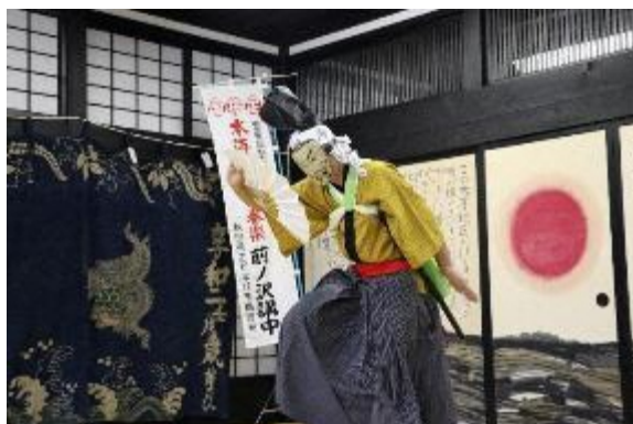
本海獅子舞番楽前ノ沢講中（秋田県由利本荘市）