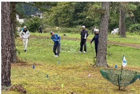
ターゲットバードゴルフ