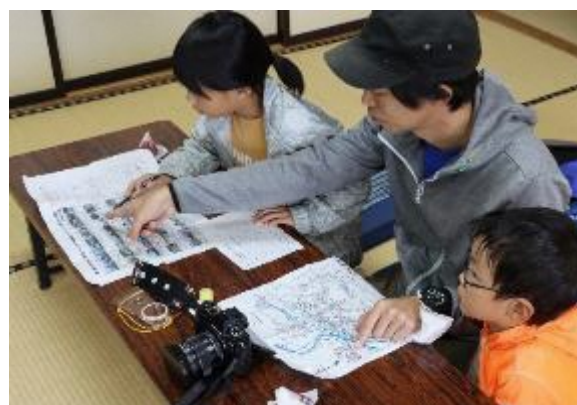
梅の里ロゲイニング