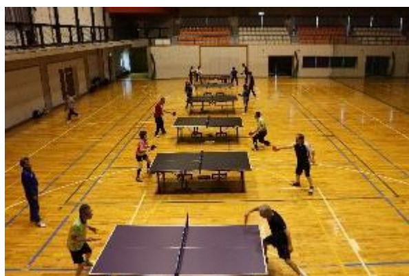
ラージボール卓球