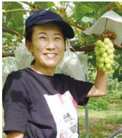
首都圏からのUターンによる新規就農

魅力ある県立高校づくりの推進 3400万円 市町村・産業界との連携やICTを 活用した授業内容の充実などにより、 魅力ある県立高校づくりを推進し、次 代の「やまがた」をつくる人材の育成・ 確保を図ります。