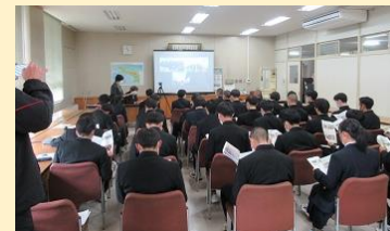
パプア州とのオンライン交流