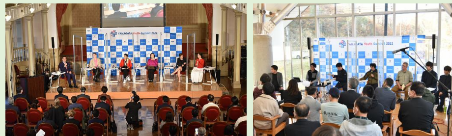
オープニングイベント