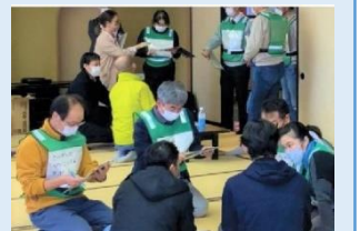
模擬避難所での聞き取り