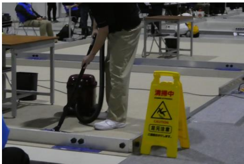
▲アビリンピック ビルクリーニング