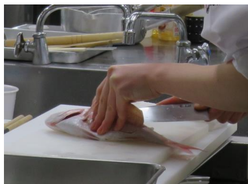
▲技能五輪 日本料理