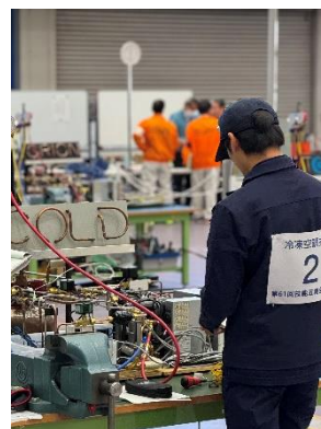
技能五輪全国大会（冷凍空調技術）