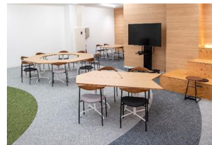
スタートアップステーション・ジョージ山形