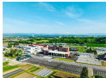
東北農林専門職大学