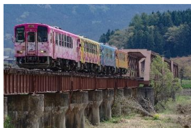
フラワー長井線 全線開通100周年記念イベント （ラッピング列車4両連結運行）