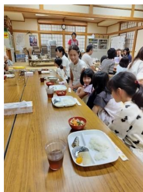
子どもの居場所（子ども食堂）