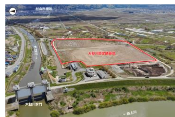
大旦川の河川改修（暫定調節池の整備）