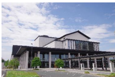
やまぎん県民ホール