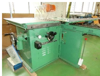
産業高校の設備の更新（丸のこ盤）