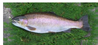
令和5年度本格デビューした「ニジサクラ」