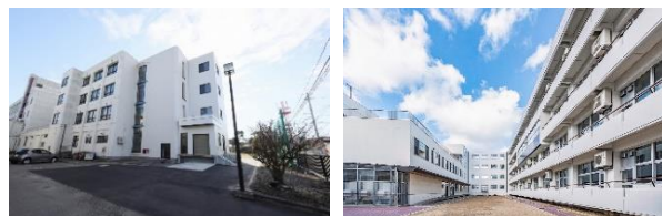
致道館中学校・高等学校（左：中学校、右：高等学校）