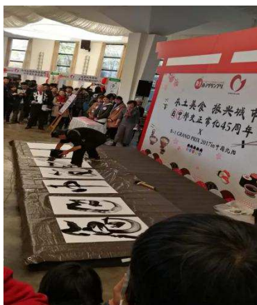
県内書道家 書の披露の様子

作品を展示するとともに、その場で来場者 150 人の要望に応じて書をプレゼントし、イベントに花を添えました。開幕セレモニーの際「日中友好」の書を即興で披露し、注目を集めていたほか、参加した方数名から、「次回はぜひ、私の街で、書道展を開催してほしい」と熱い要望を受けていました。