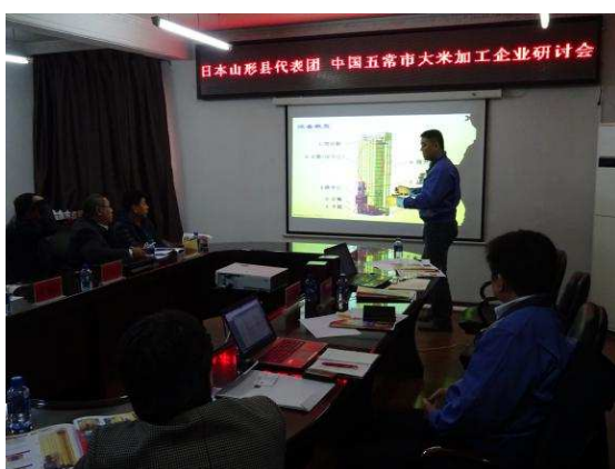
企業交流会の様子

ハルビン事務所では、黒龍江省関係各省庁を通し、現地企業のサポートを行っております！