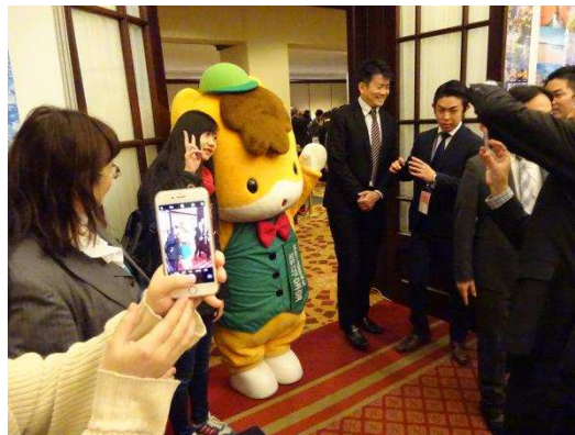
ご当地キャラクターも登場