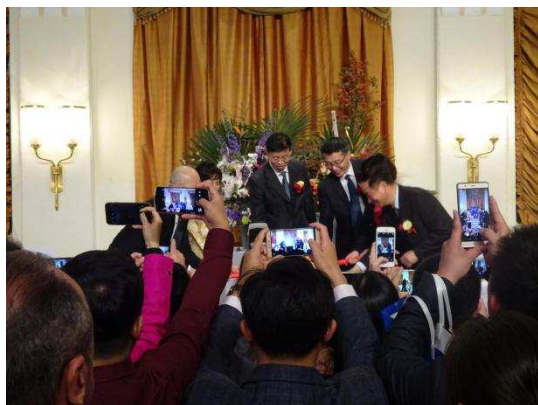
上海日本総領事館 鏡割りの様子

上海での山形県の知名度はあまり高くないとのことであり、レセプション参加者からは、パンフレットを眺めながら、「山形にはどうやって行けるか」などの質問が寄せられました。