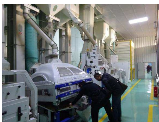
現地企業 工場内視察の様子