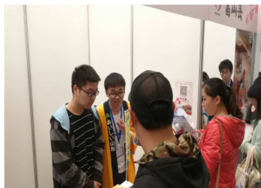
県観光パンフレット配布の様子