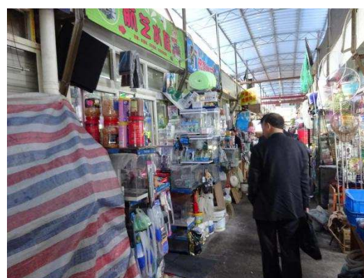
上海市内水族用品市場視察の様子