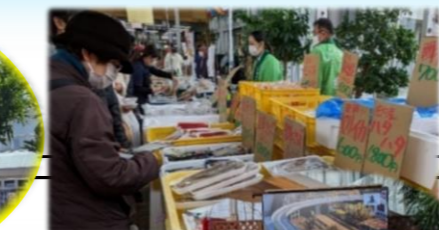
線路がつなぐ 石巻・庄内海鮮市