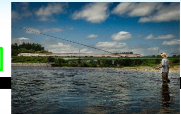
鉄道特別賞「つばさを見ながら」賞品（陸羽東線全27駅駅名プレート）