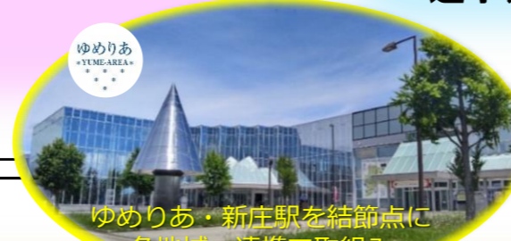
ゆめりあ・新庄駅を結節点に 各地域・連携で取組み