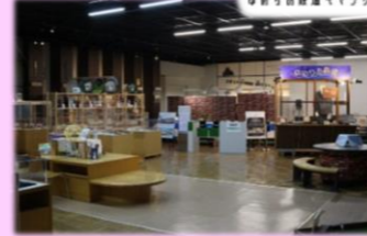
ゆめりあ鉄道ギャラリー