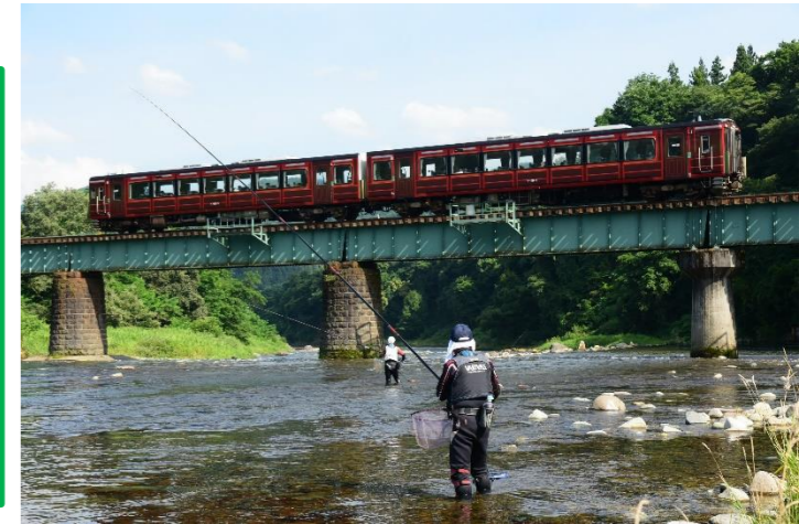
第8回最上小国川写真コンテスト 優秀賞 「静と動」