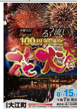
水郷大江夏まつり灯るう流し花火大会(大江町)