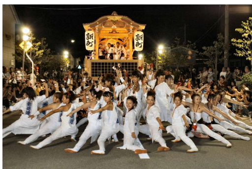
徳内まつり(村山市)