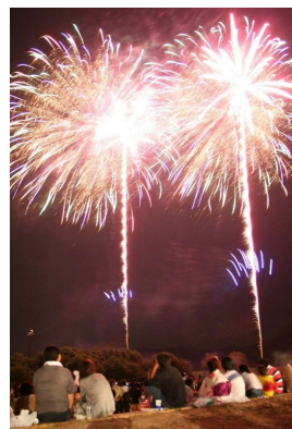
最上川花火大会(長井市)