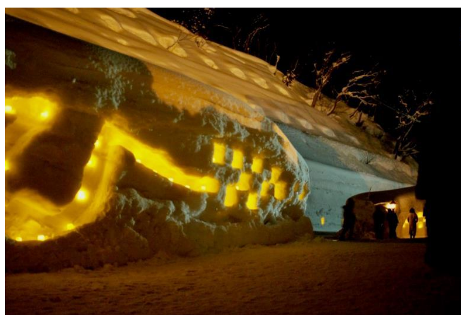
肘折幻想雪回廊(大蔵村)