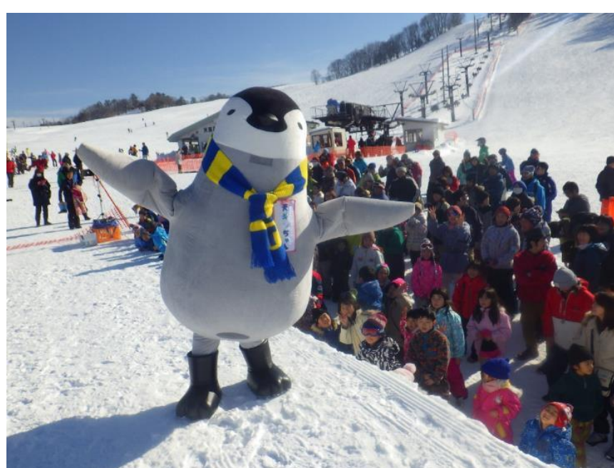
天童高原スキー場(天童市)