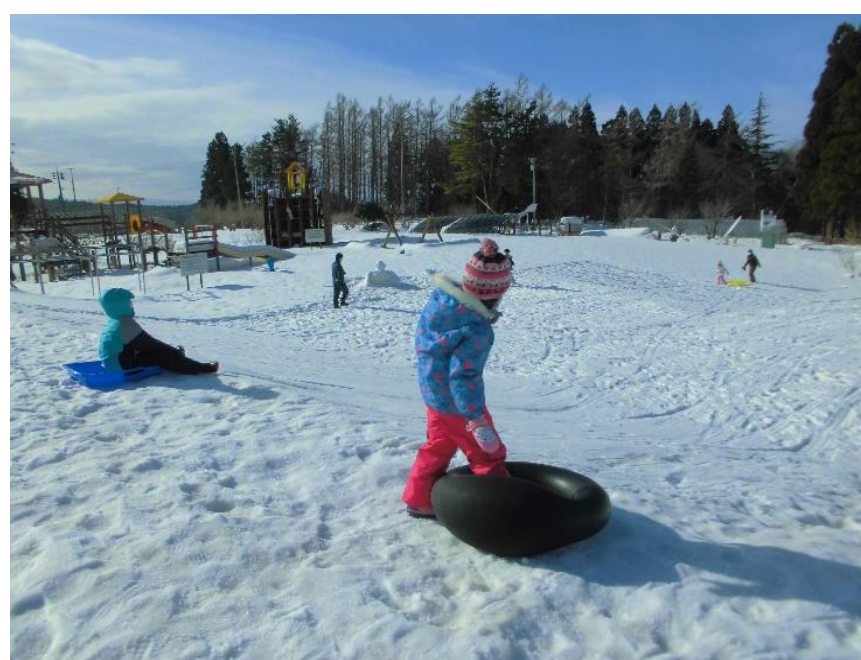
雪であそぼうin風車村(庄内町)