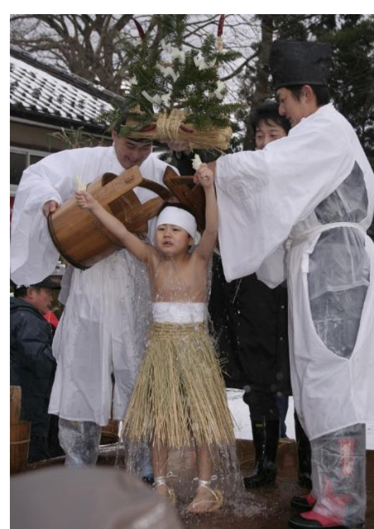
東北の奇祭 やや祭り(庄内町)