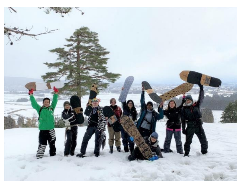
アルカディア雪板乗り体験(長井市)