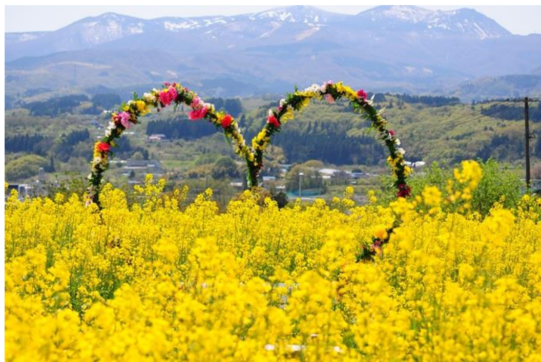
ヴェンテングルテン(上山市)