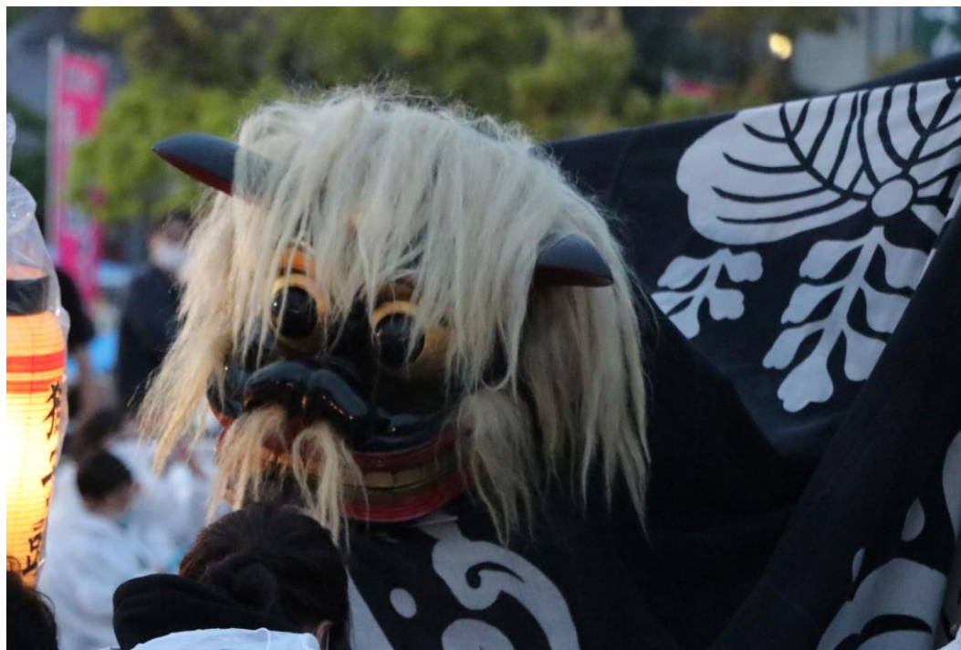
ながい黒獅子まつり(長井市)