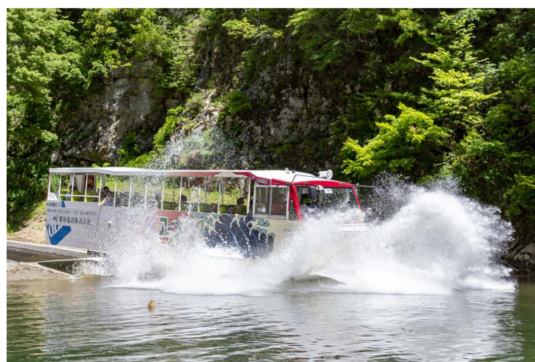
水陸両用バスinながい百秋湖(長井市)