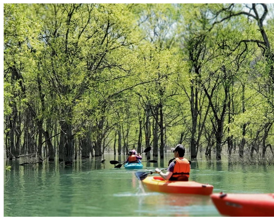
白川湖カヌー・SUPツアー(飯豊町)