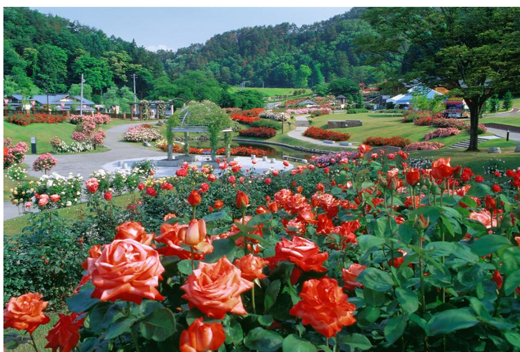
バラまつり2023(村山市)