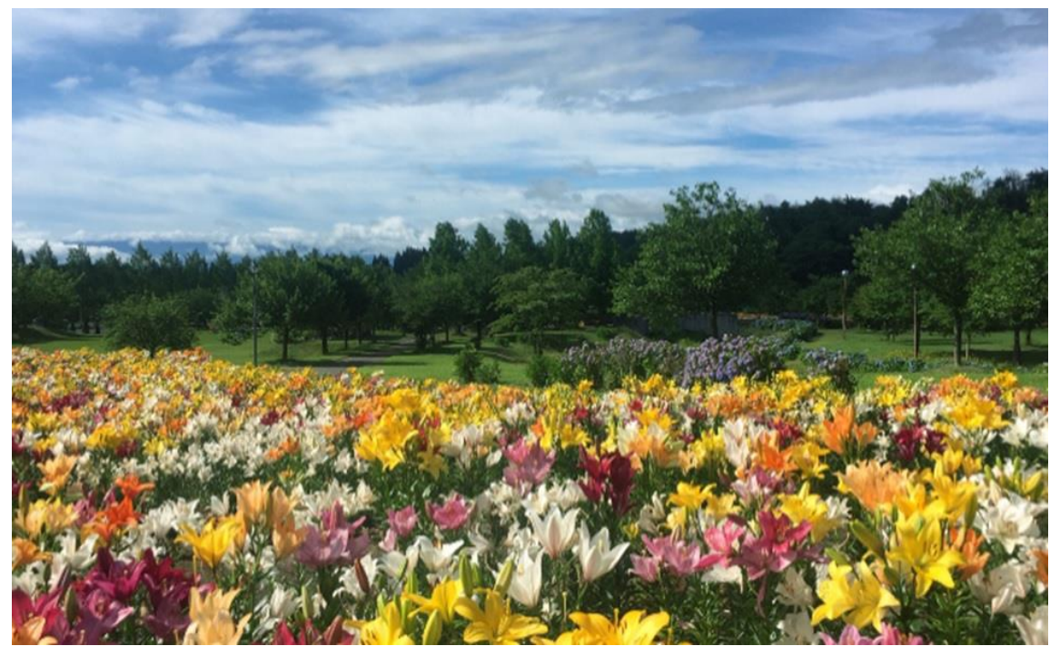
いいでどんでん平ゆり園(飯豊町)