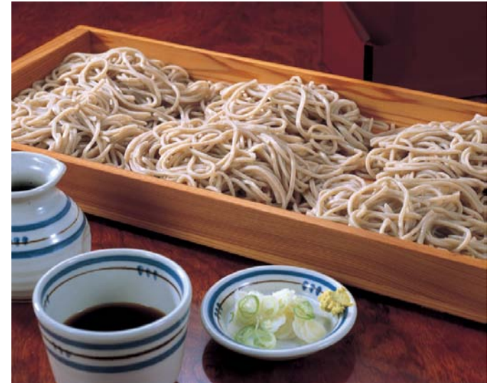
村山市 板そばまつり