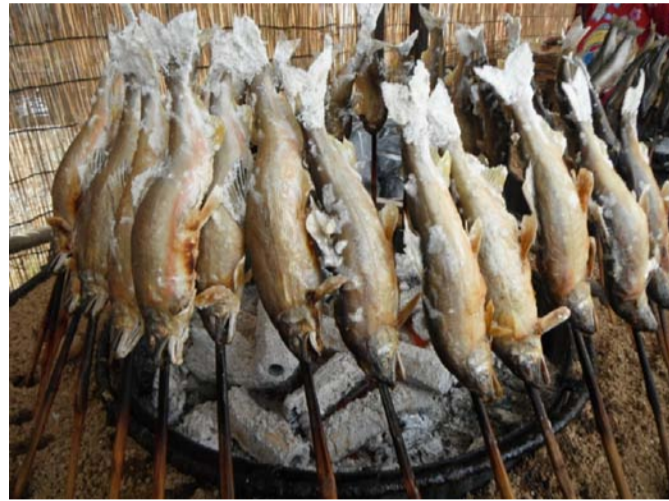
白鷹町 天然鮭感謝デー