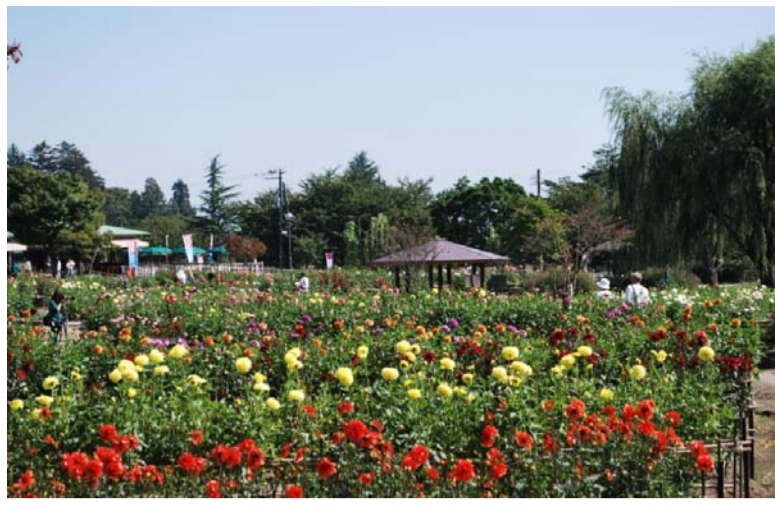
川西町 ダリヤ切り花収穫デー