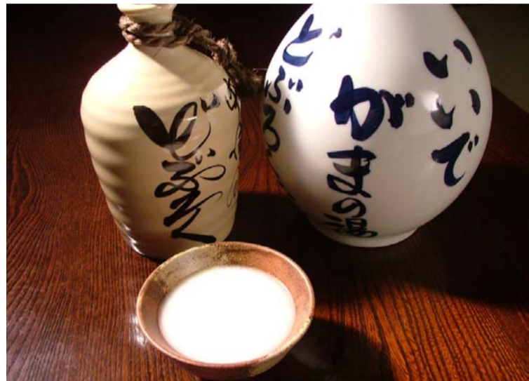
飯豊町 どぶろく新酒発表会