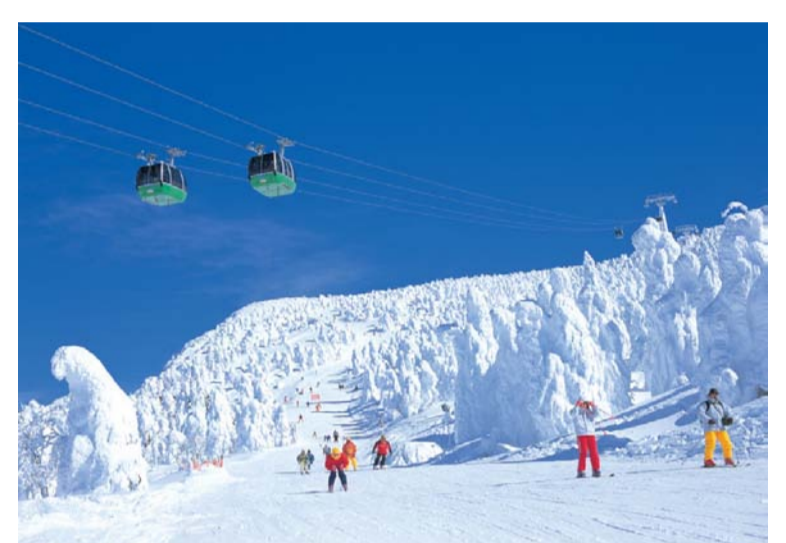
蔵王温泉スキー場開き