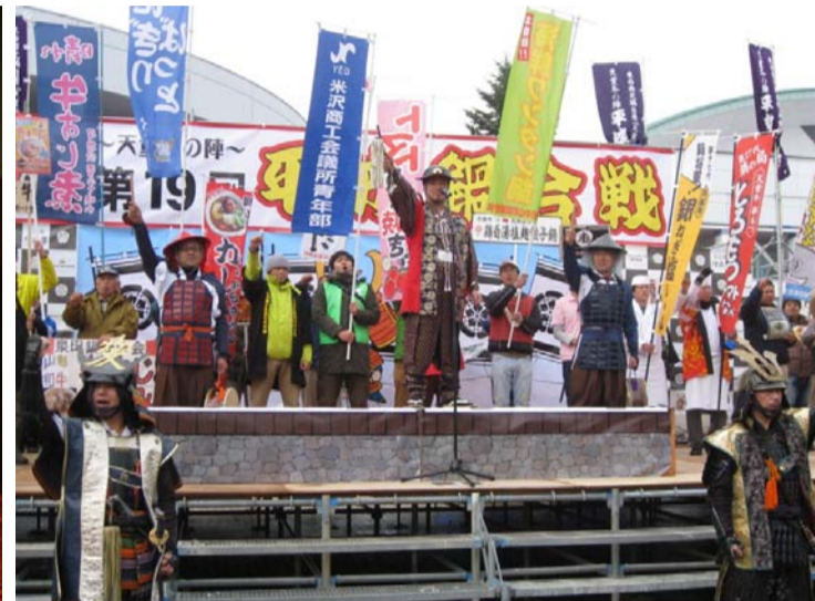
天童市 第20回平成鍋合戦