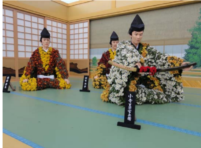
第102回 南陽の菊まつり