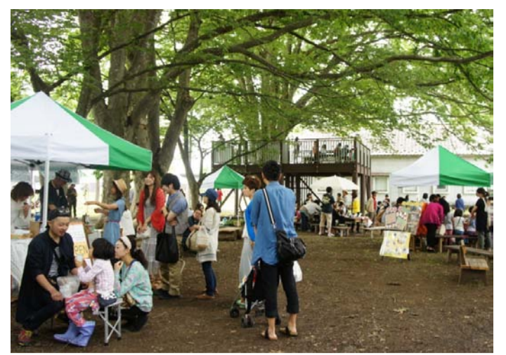
新庄市 kitokito MARCHÉ