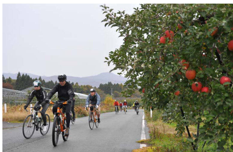
第25回かみのやまツール・ド・フランス