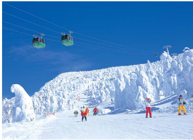
蔵王温泉スキー場開き