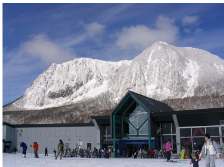
東根市 ジャングル・ジャングル オープン