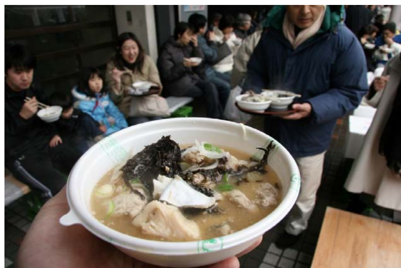
寒鱈まつり(鶴岡市、遊佐町、酒田市)