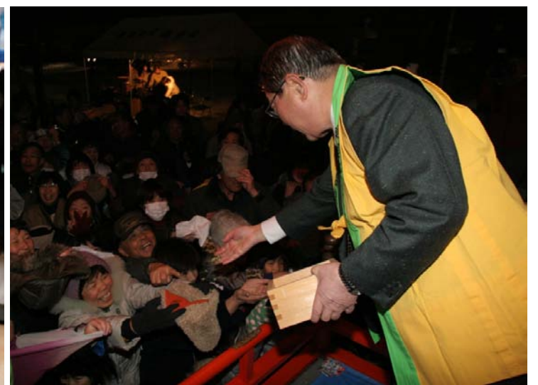
第39回ひがしね雪まつり