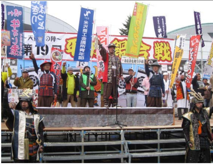
天童市 第20回平成鍋合戦