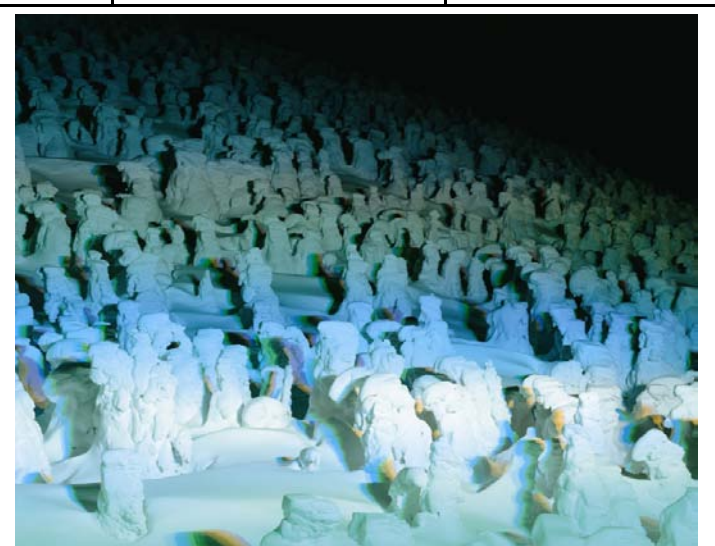
蔵王 デイライト&ライトアップ樹氷