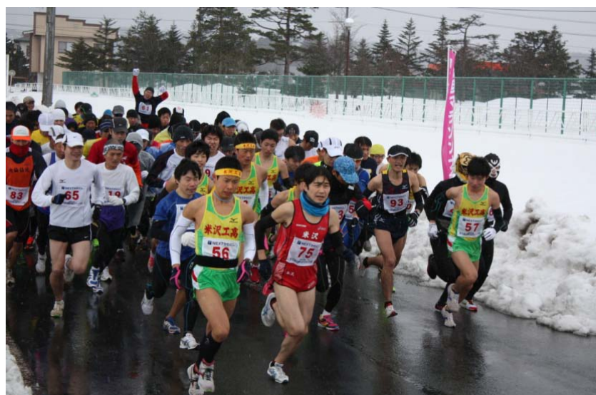
川西町 元旦マラソン