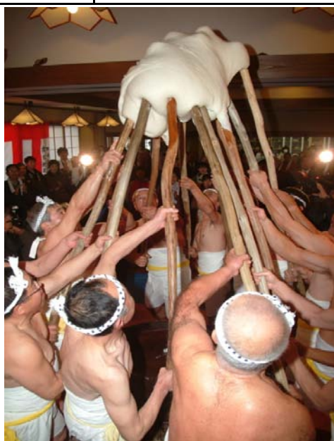
上山市 高松観音 御年越餅搗行事