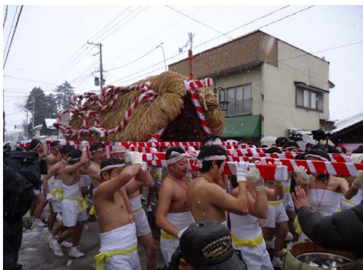
たかはた冬まつり わらじみこしまつり