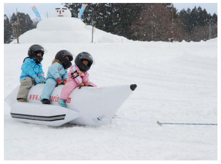
飯豊町 どんでん平スノーパーク OPEN