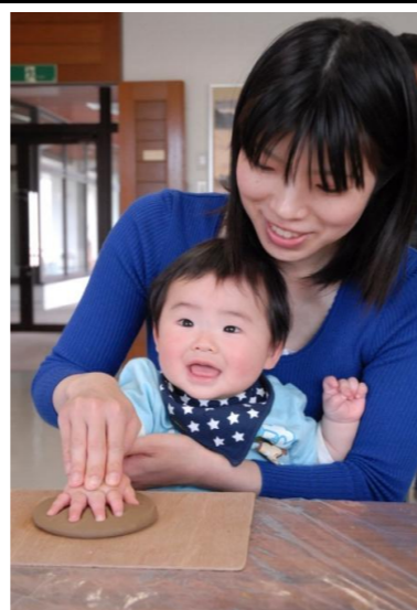
高畠町 赤ちゃんの手形をつくろう