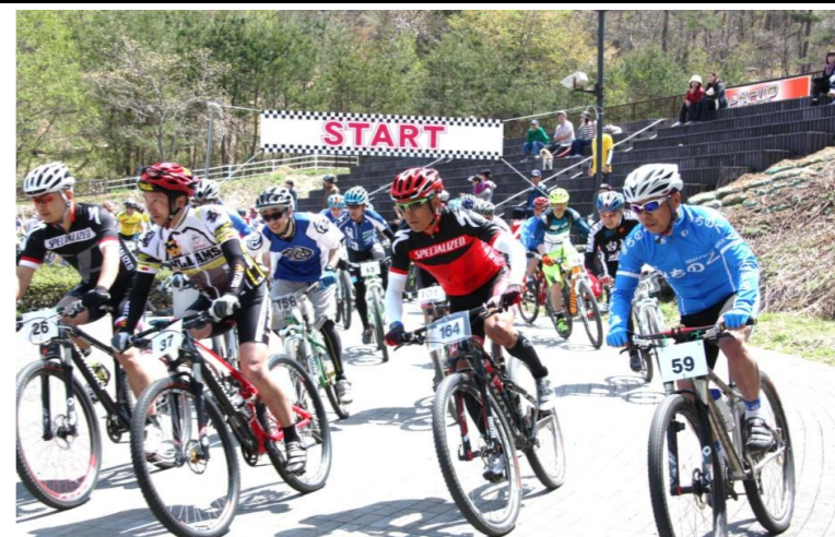
川西町 まどかカップ マウンテンバイク大会