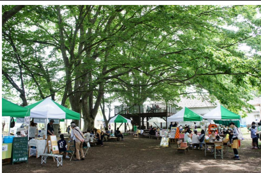
新庄市 kitokito MARCHE(キトキトマルシェ)