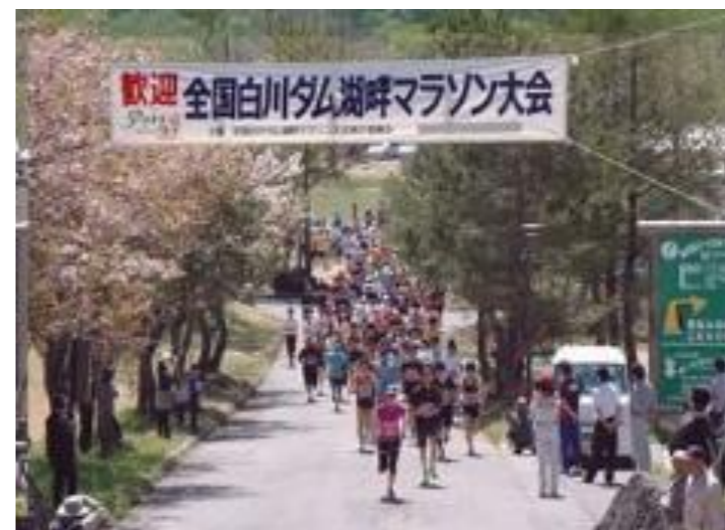
飯豊町 第33回全国白川ダム湖畔マラソン大会