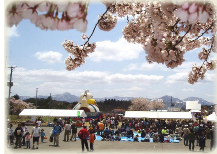
尾花沢市 徳良湖まつり