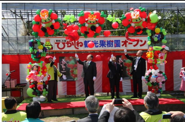
東根市 さくらんぼ観光果樹園オープン