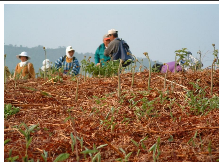
飯豊町 観光ワラビ園