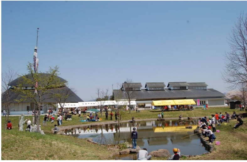
高畠町 ひろすけこども祭