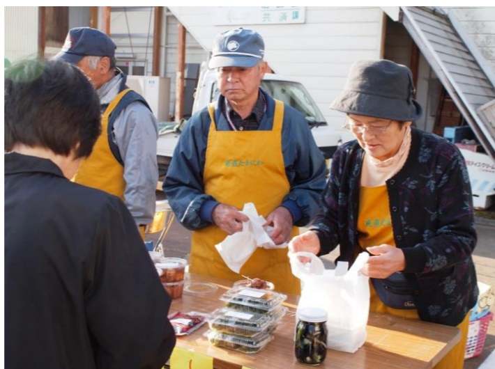
川西町 ニュースタイル朝市 こまつ市