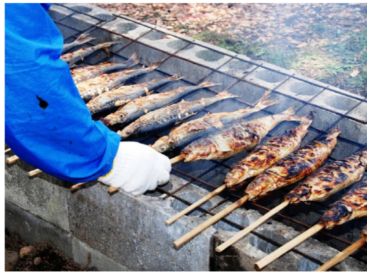
新庄市 新庄カド焼きまつり