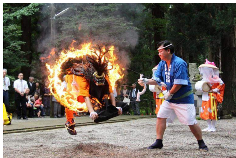
川西町 川西夏まつり