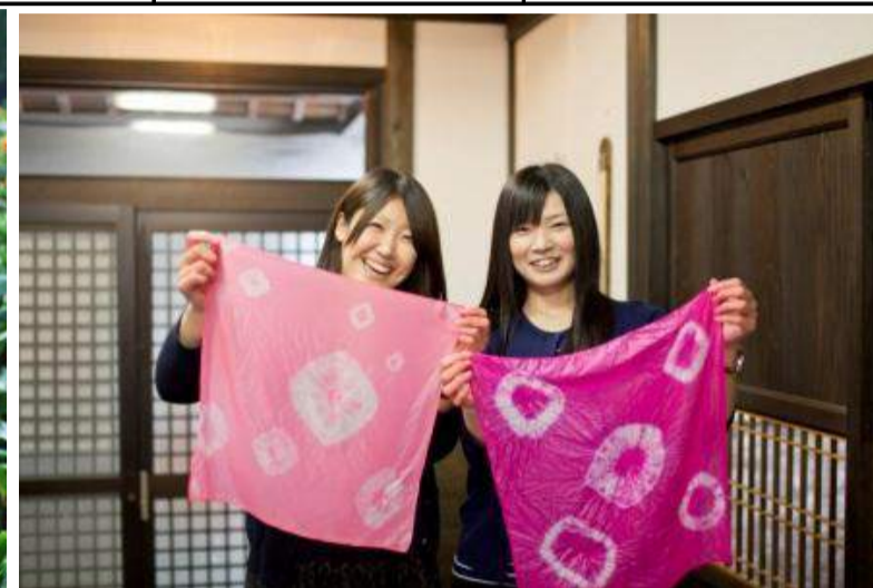
白鷹町 白鷹町産業フェア2015