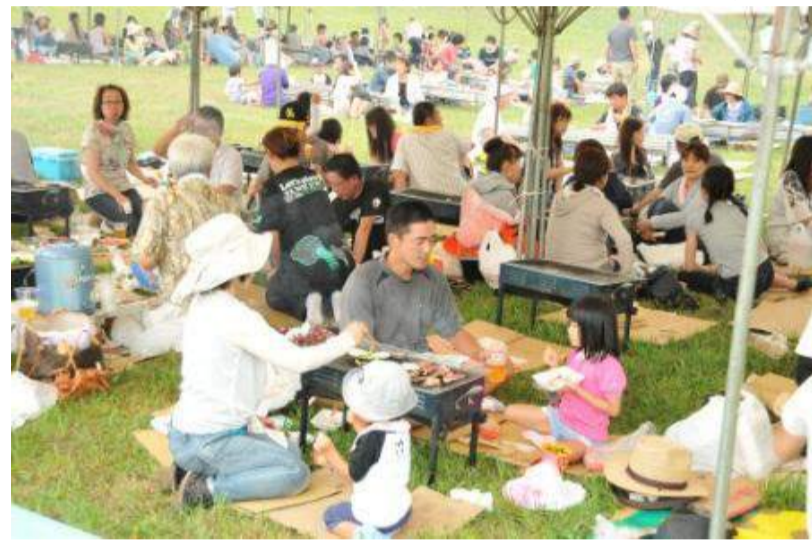
天童市 第26回天童高原まつり