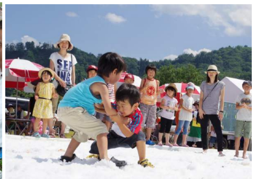
飯豊町 SNOWえっぐフェスティバル