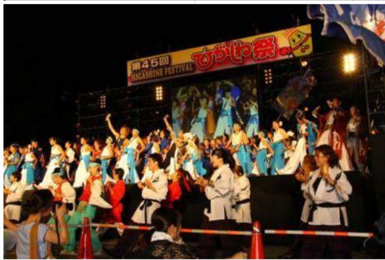
東根市 ひがしね祭