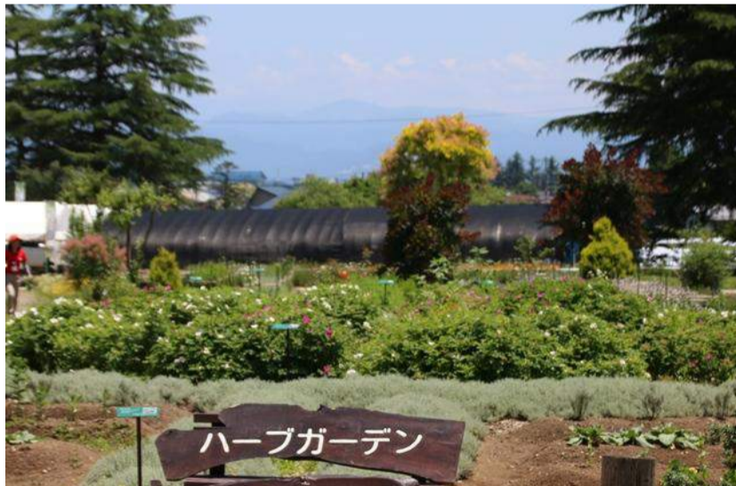
川西市 置賜公園ハーブガーデンフェア