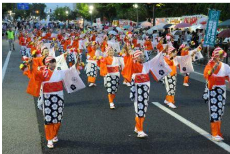
天童市 天童夏まつり