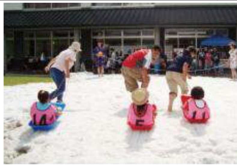
飯豊町 めざみ祭り(お盆編・真夏の雪まつり)