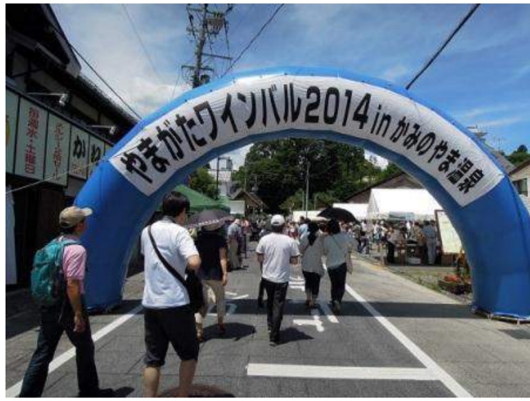
上山市 やまがたワインバル2015 inかみのやま温泉