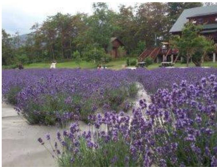
山辺町 山辺町ラベンダー祭