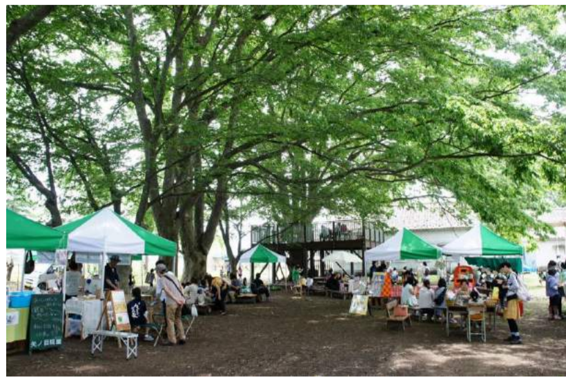
新庄市 kitokito MARCHE (キトキトマルシェ)