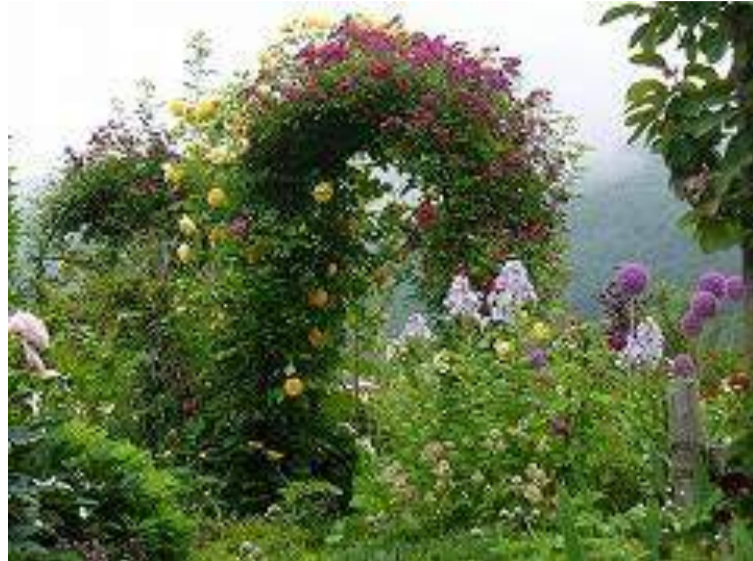
上山市 蔵王ペンション村