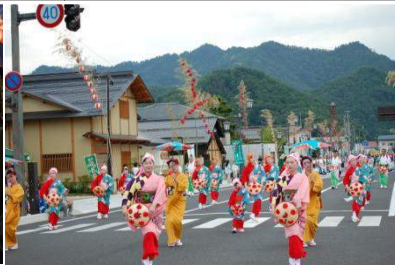
高畠町 たかはた夏まつり「青竹ちょうちんまつり」