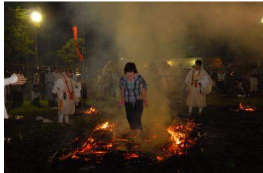
東根市 さくらんぼ東根温泉火渡り式