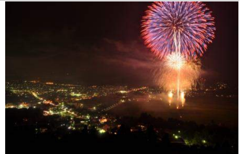
鶴岡市 国指定重要無形民俗文化財 黒川能野外能楽第32回 「水焰の能」