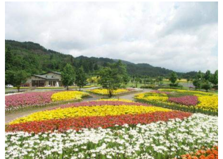
飯豊町 いいでどんでん平ゆり園