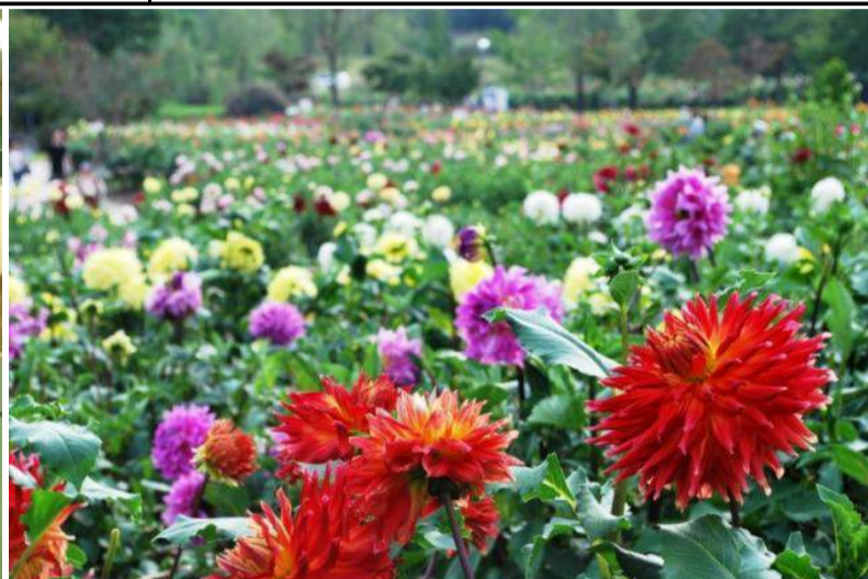
川西町 川西ダリヤ園オープン