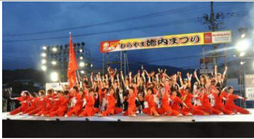
村山市 むらやま徳内まつり