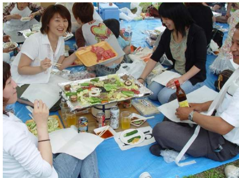
飯豊町 いいで黒べこまつり