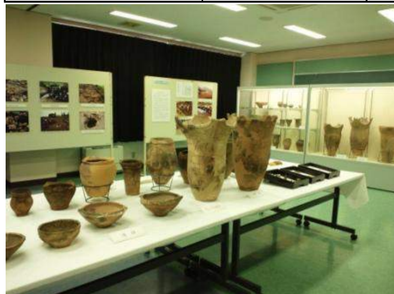
舟形町 縄文の女神里帰り展