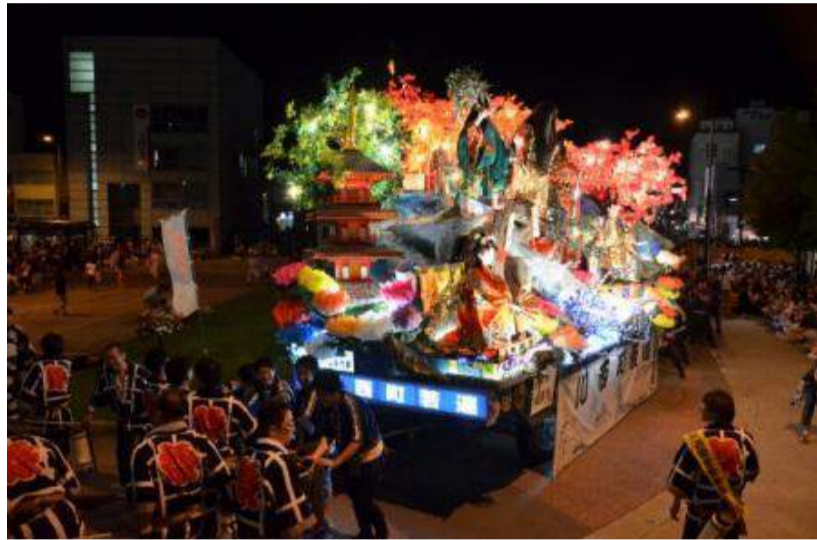
新庄市 新庄まつり260年祭