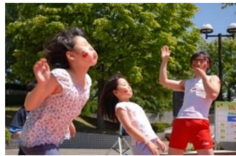
東根市 さくらんぼ種飛ばしワールドグランプリ