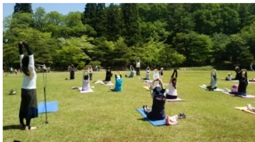
山辺町 県民の森 新緑まつり