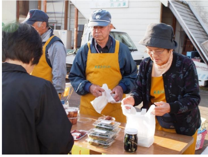
川西町 ニュースタイル朝市こまつ市