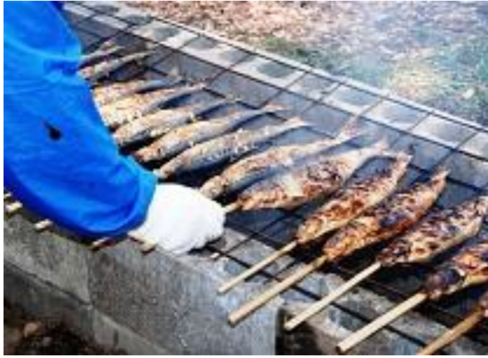
新庄市 新庄カド焼きまつり