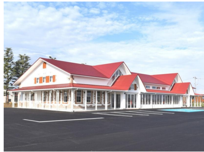
川西町 かわにし森のマルシェ オープン