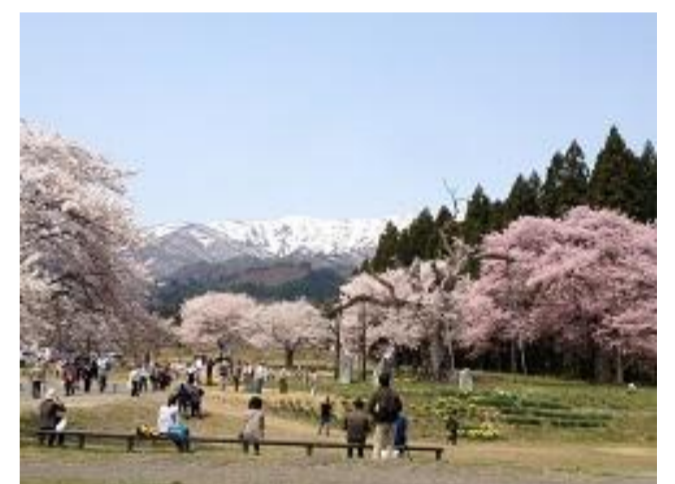
白鷹町 釜の越・薬師さくらまつり