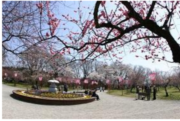
真室川町 第44回真室川梅まつり