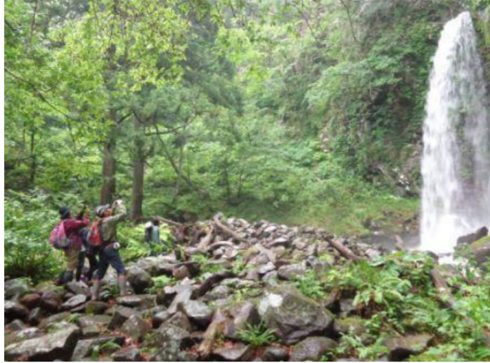
遊佐町 高瀬峡ハイキング