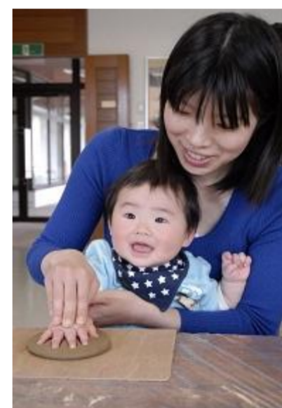
高畠町 赤ちゃんの手形をつくろう