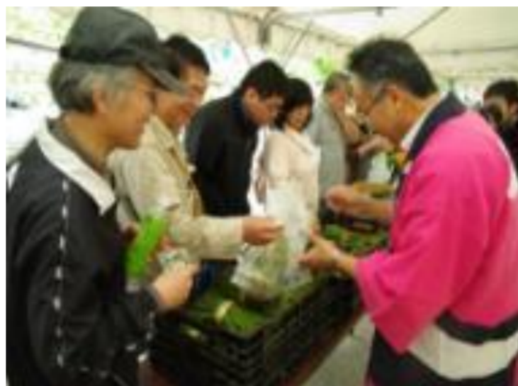
飯豊町 中津川山菜まつり