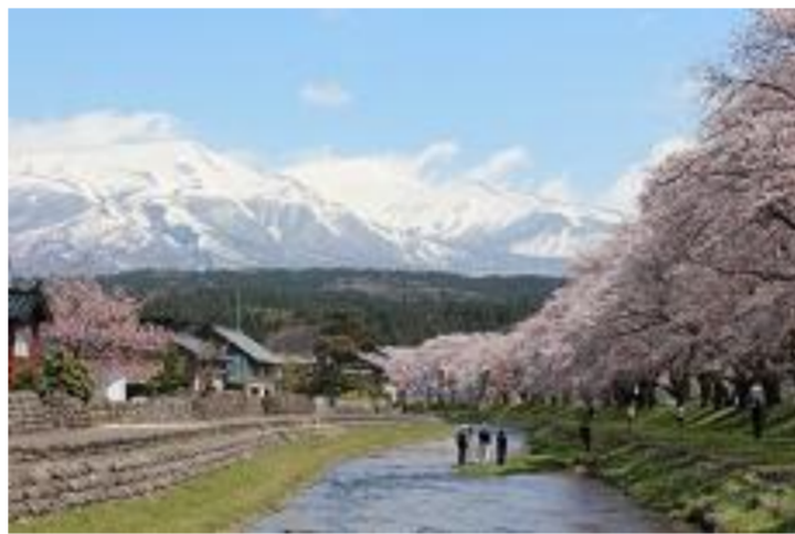
遊佐町 中山河川公園さくらまつり2016