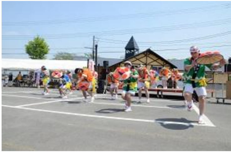
尾花沢市 第47回尾花沢徳良湖まつり