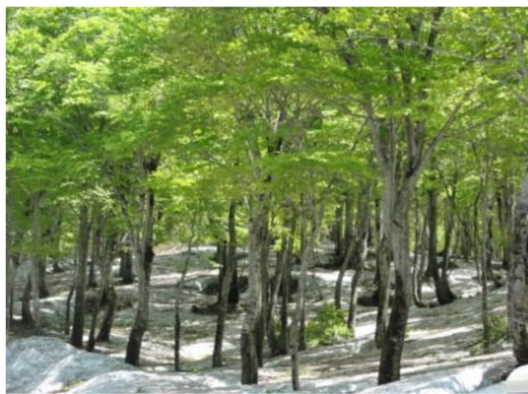
西川町 残雪とブナ林トレッキング