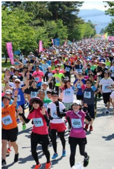
東根市 さくらんぼ マラソン大会