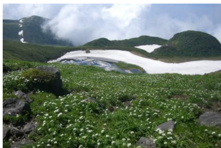
遊佐町 花と風景の山旅ツアー