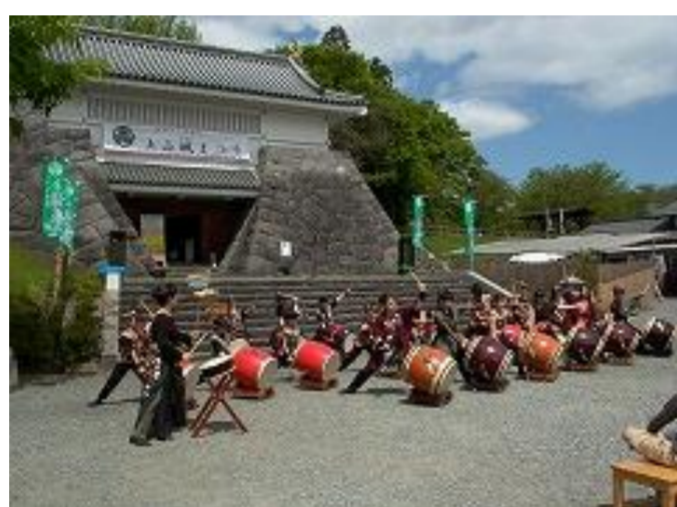
上山市 上山城まつり