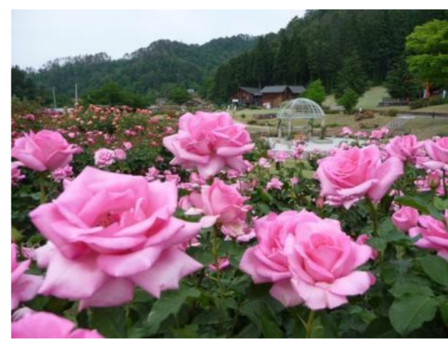
村山市 バラまつり2016