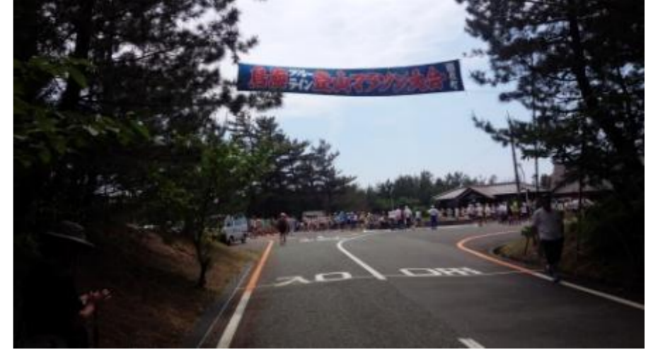
遊佐町 鳥海ブルーライン登山マラソン