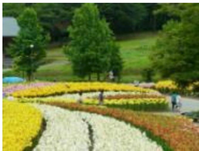
飯豊町 いいでどんでん平ゆり園オープン