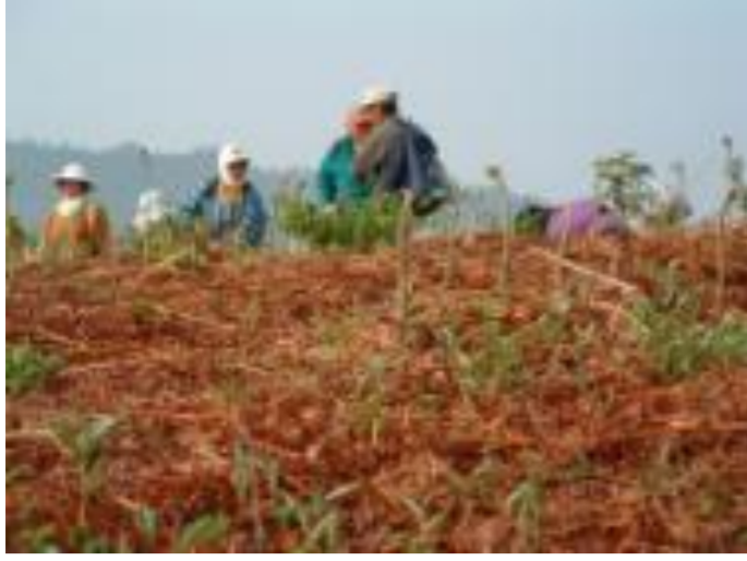
飯豊町 観光ワラビ園