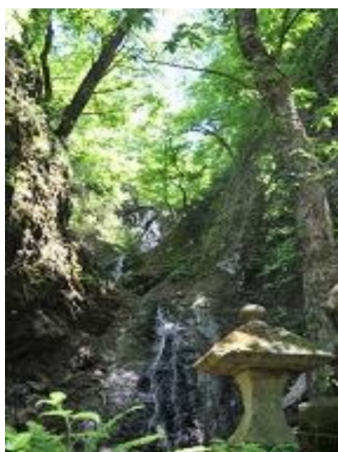
白鷹町 三ツ滝不動尊 祭礼