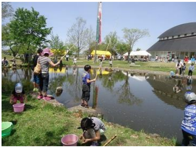
高畠町 ひろすけ子ども祭