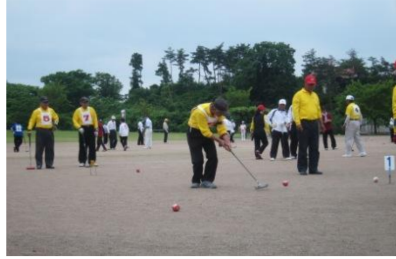
東根市 さくらんぼゲートボール全国大会