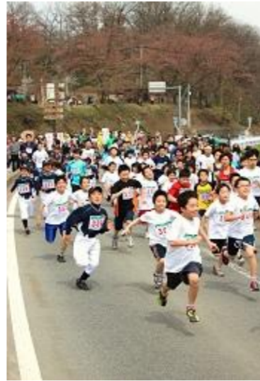
真室川町 第29回 梅の里マラソン大会