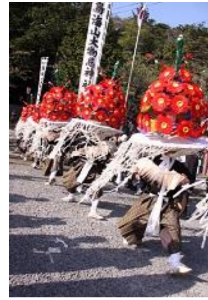
遊佐町 鳥海山大物忌神社 吹浦口ノ宮例大祭