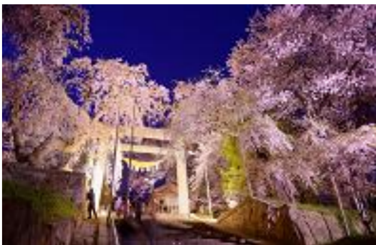
南陽市 赤湯温泉桜まつり 烏帽子山公園ライトアップ