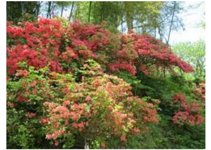
天童市 天童つつじまつり