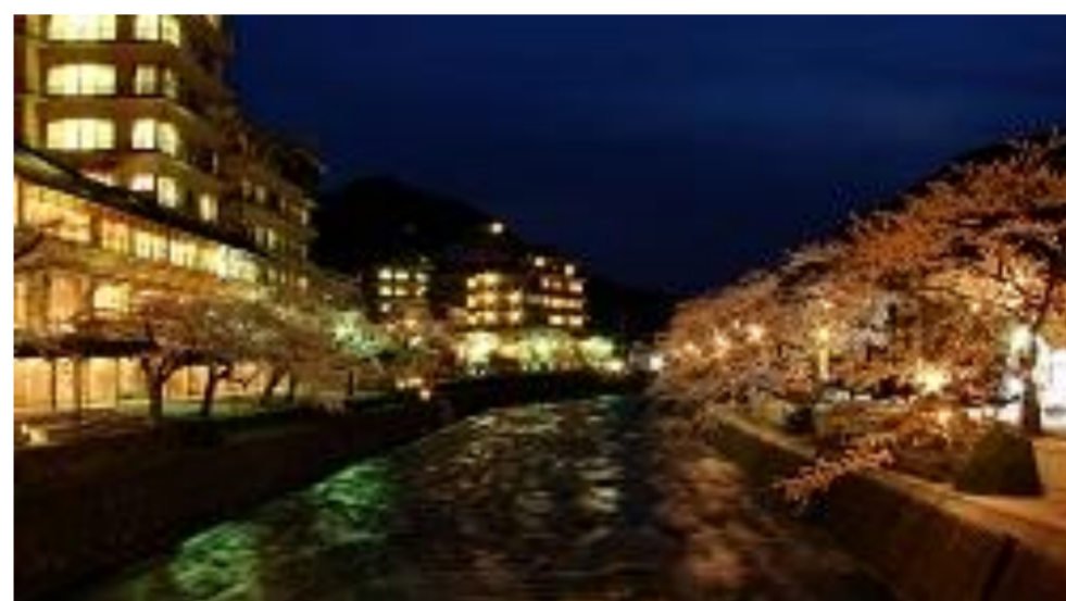
鶴岡市 あつみ温泉 温海川河畔桜並木