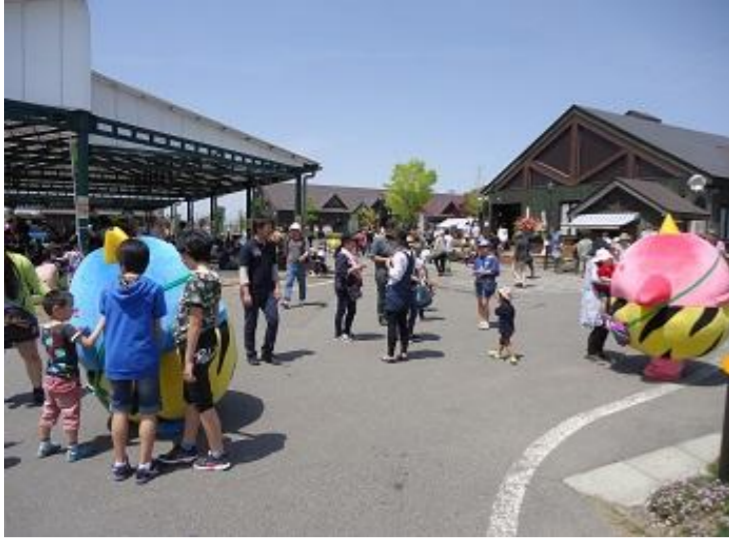
高島町 高島ワイナリー スプリングフェスタ