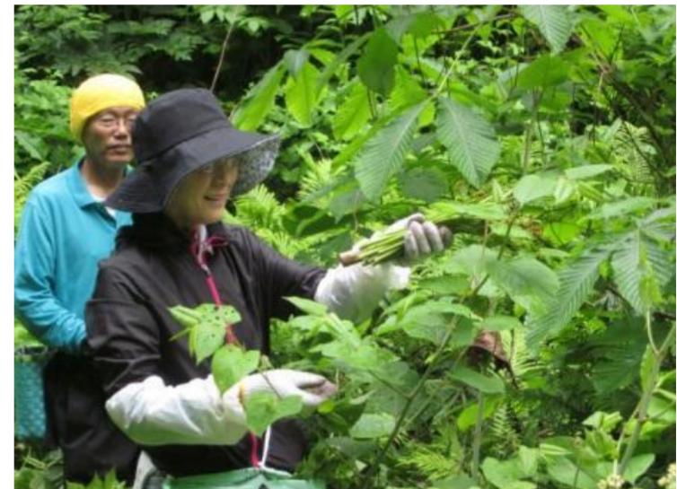
尾花沢市 山菜まつり