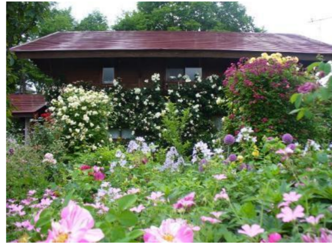
上山市 蔵王ペンション村オープンガーデン