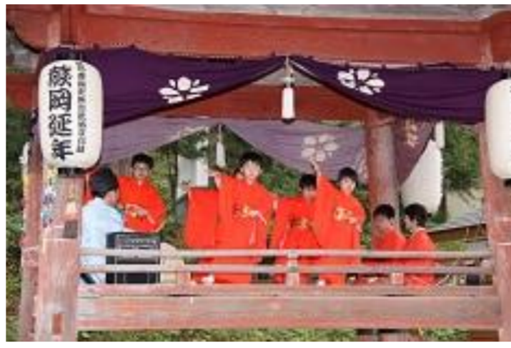
遊佐町 鳥海山大物忌神社 藤岡口ノ宮例大祭