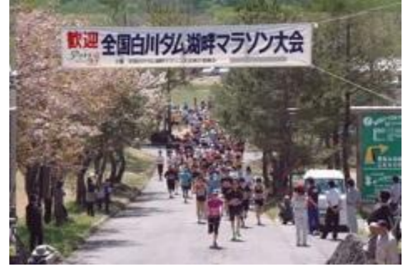
飯豊町 第34回全国白川ダム湖畔 マラソン大会