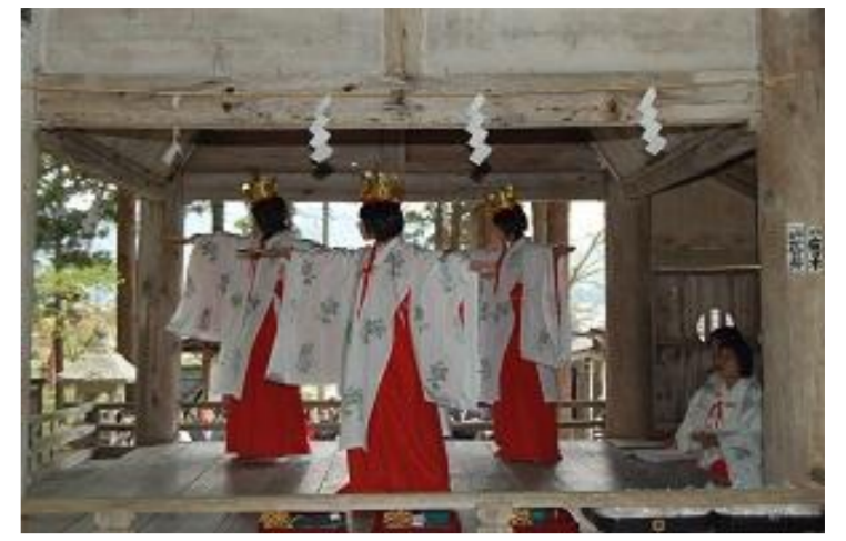
高畠町 安久津八幡神社春まつり