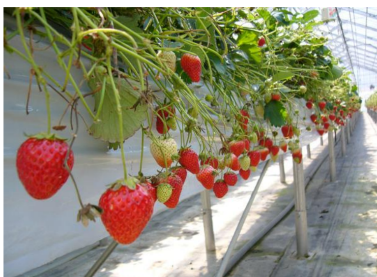
飯豊町 いちご狩り