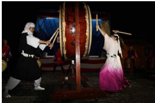
瀬見まつり(最上町)