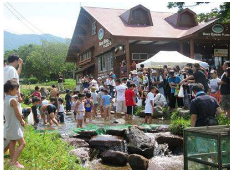
前森高原サマーフェスティバル(最上町)