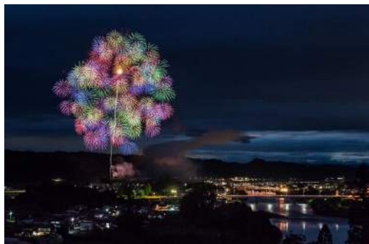
大石田まつり「最上川花火大会」(大石田町)