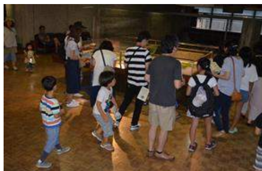
夏の博物館まつり(山形市)