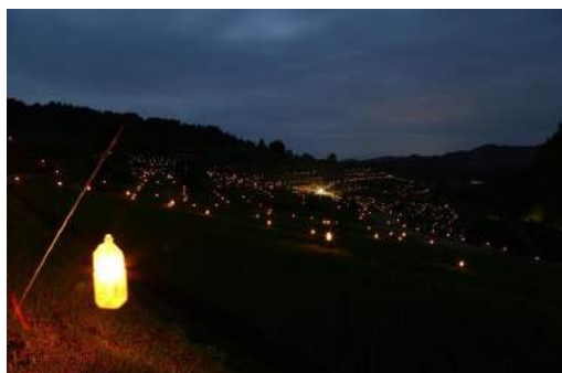
四ヶ村棚田ほたる火コンサート(大蔵村)