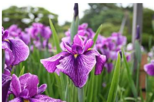
あやめまつり(長井市)