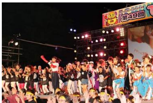
↑ひがしね祭(東根市)