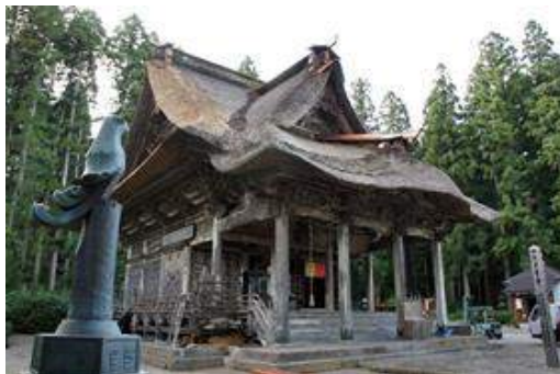
置賜三十三観音 19番札所 笹野観音(米沢市)