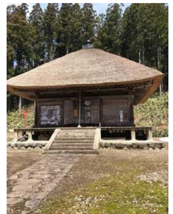
8番札所 深山観音(白鷹町)