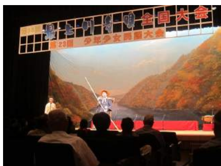
最上川舟唄全国大会(東根市)