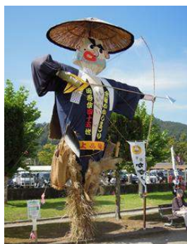
第49回かみのやま温泉全国かかし祭