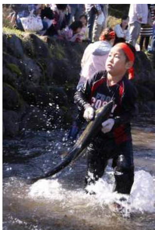
鮭のつかみどり大会(遊佐町)