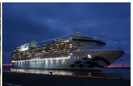
ダイヤモンド・プリンセス寄港(酒田市)