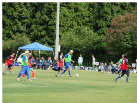
第5回 Super Senior Soccer2019 いきいき輝くSuper Age(0-80)サッカーin山形もがみ大会(最上町)