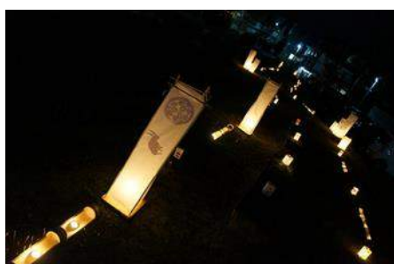
赤倉温泉 豆名月・栗名月(最上町)