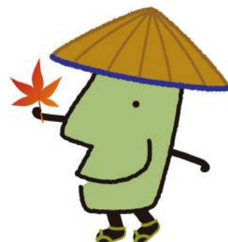
第51回最上町総合芸術文化祭(最上町)