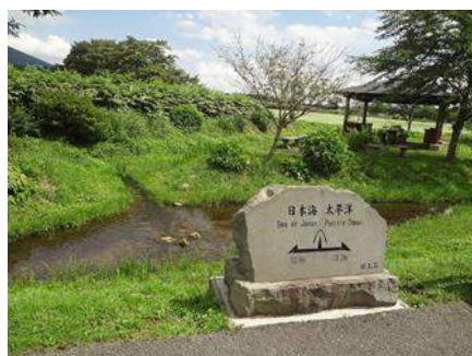
堺田分水嶺秋のコンサート(最上町)