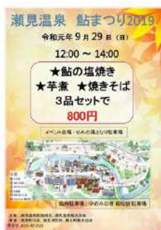
瀬見温泉 鮎まつり2019(最上町)