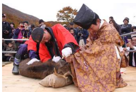
鳥海山神鹿角切祭(遊佐町)