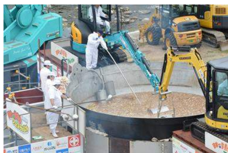
第31回日本一の芋煮会フェスティバル(山形市)